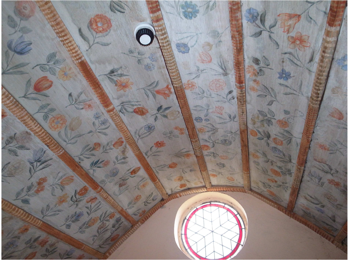
Bemaltes Holzgewölbe Sakristei, November 2013