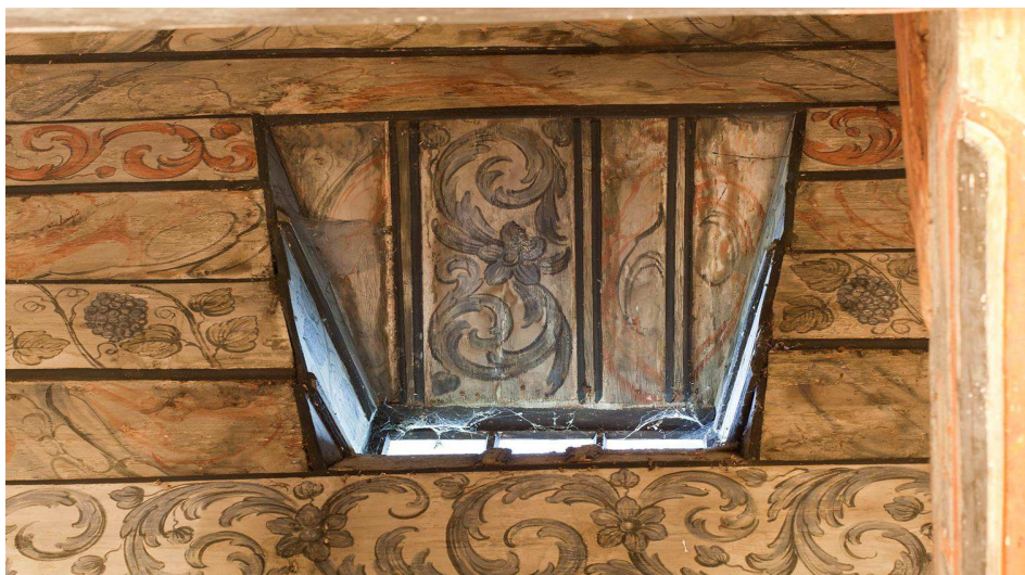
Dachöffnung in polychrom gefasster Deckenpartie, 2014