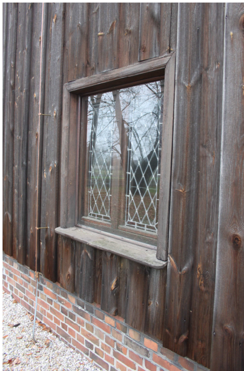
Ausschnitt Süd-Querhaus mit Bleiglasfenster, November 2014