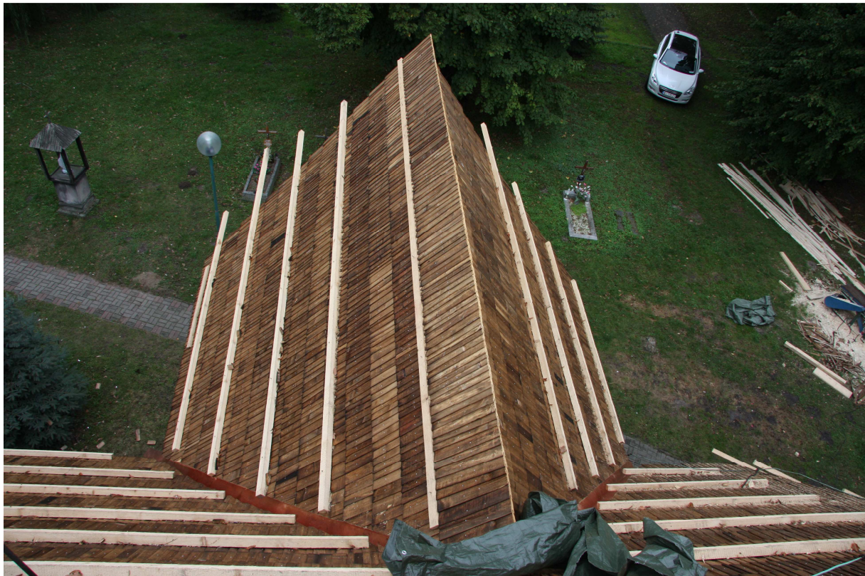
Dachneueindeckung nördliches Querhaus in Arbeit, Anf. Oktober 2014