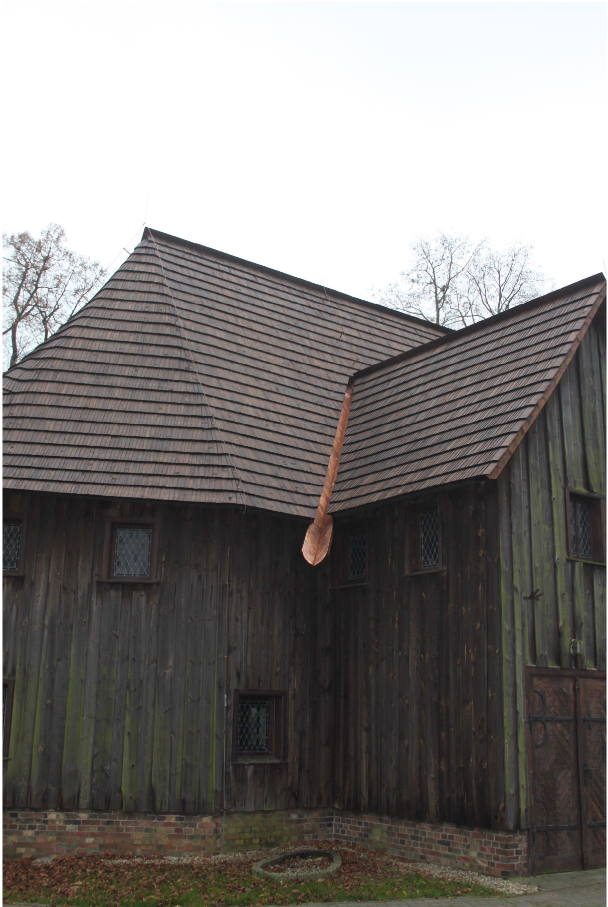
Ausschnitt Nordseite mit neu gedecktem Chor und Querhaus, Ende November 2014