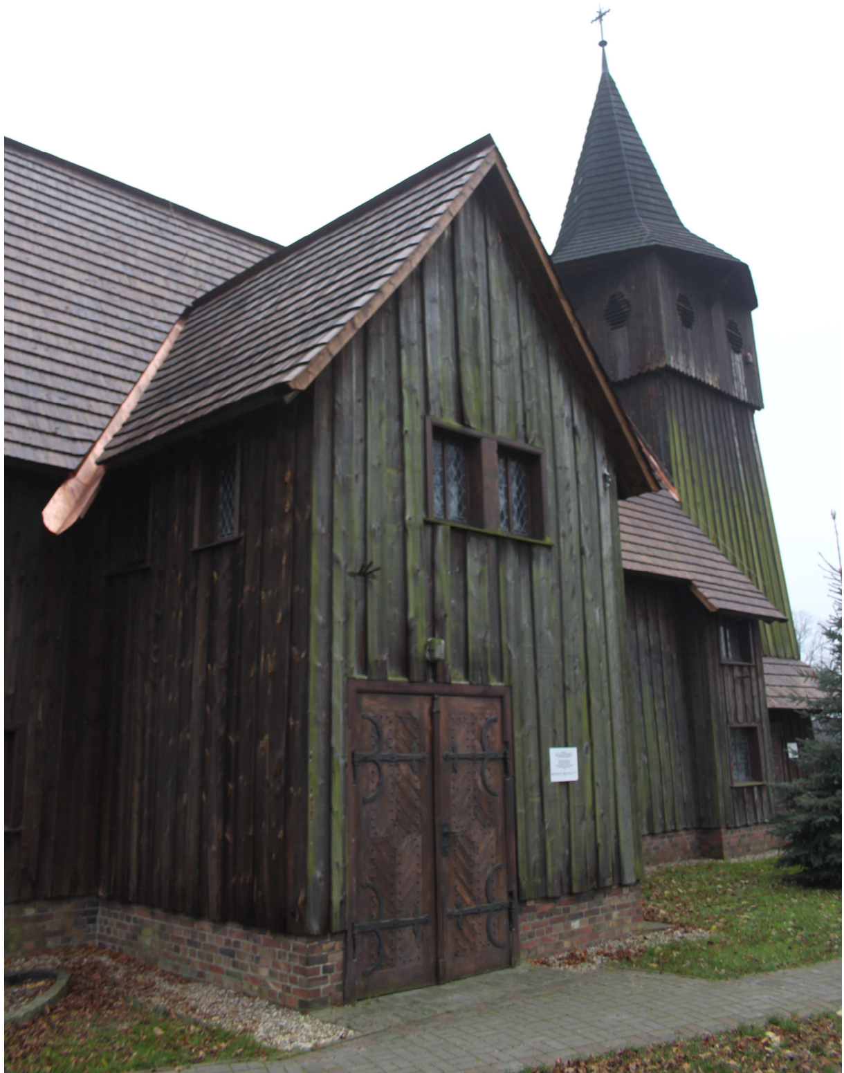
Querhaus Nordseite nach Erneuerung Holzschindeldeckung, Ende November 2014