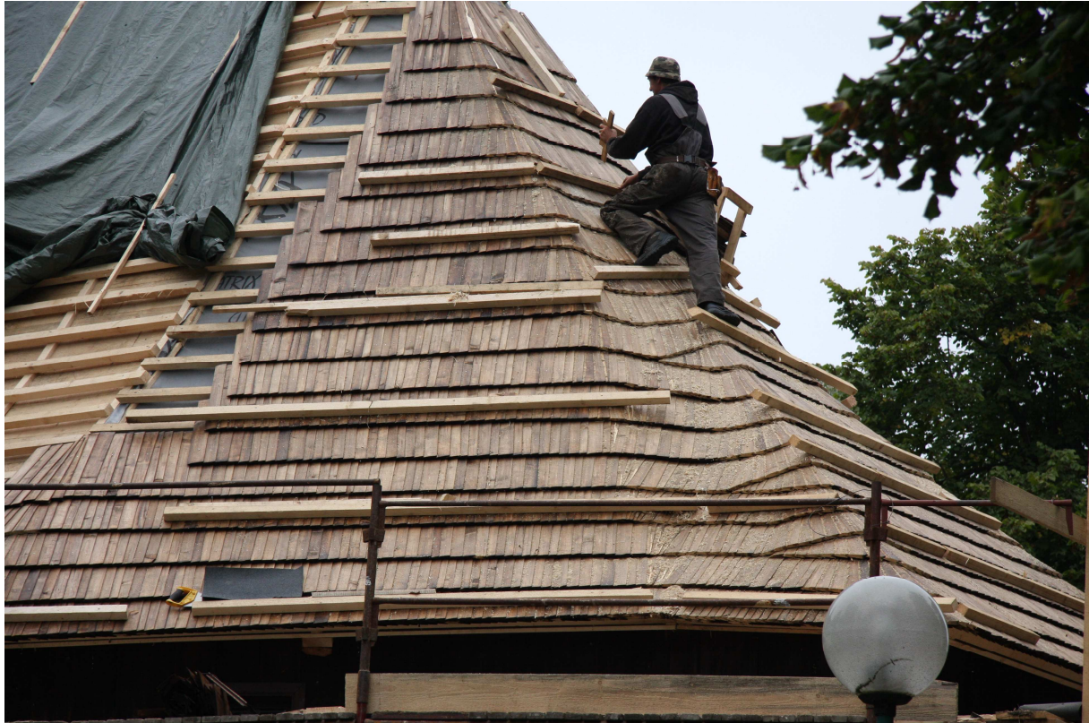
Chordachneueindeckung in Arbeit, Anf. Oktober 2014