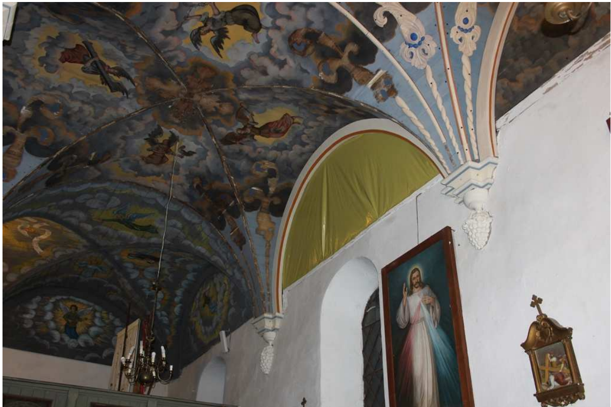
5. Etappe (2015): nördl. Gewölbefeld des 4. Jochpaars von Osten nach Restaurierung, Dezember 2015