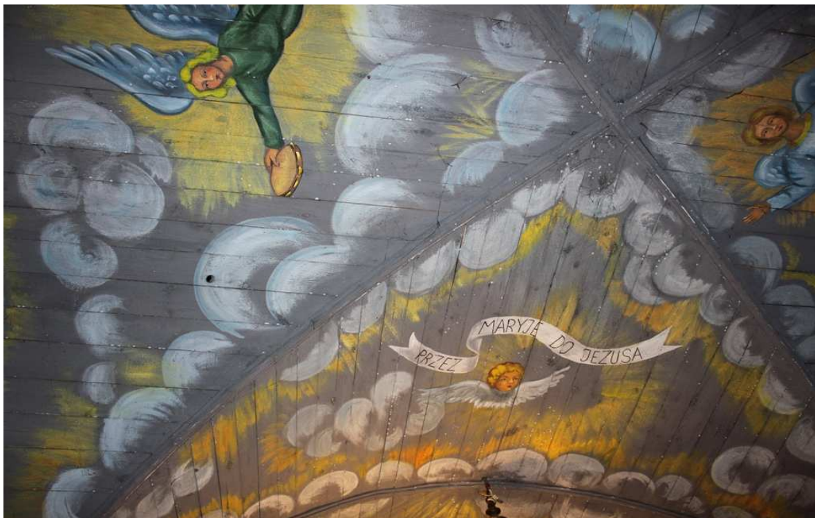
Ausschnitt nachkriegszeitliche Malerei des 5. Gewölbejochs von Osten, Dezember 2015