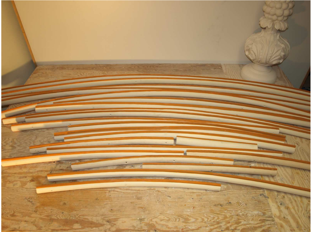
5. Etappe (2015): Demontierte Gewölberippen der Scheingewölbedecke das vierte Joch von Osten betreffend, Dezember 2015