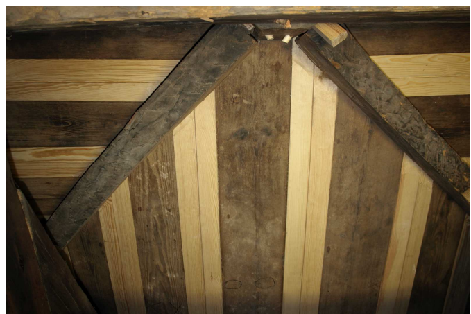
5. Etappe (2015): Tischlermäßig instandgesetzter Fehlboden über Scheingewölbedecke betreffend 4. Gewölbejoch von Osten, Herbst 2015