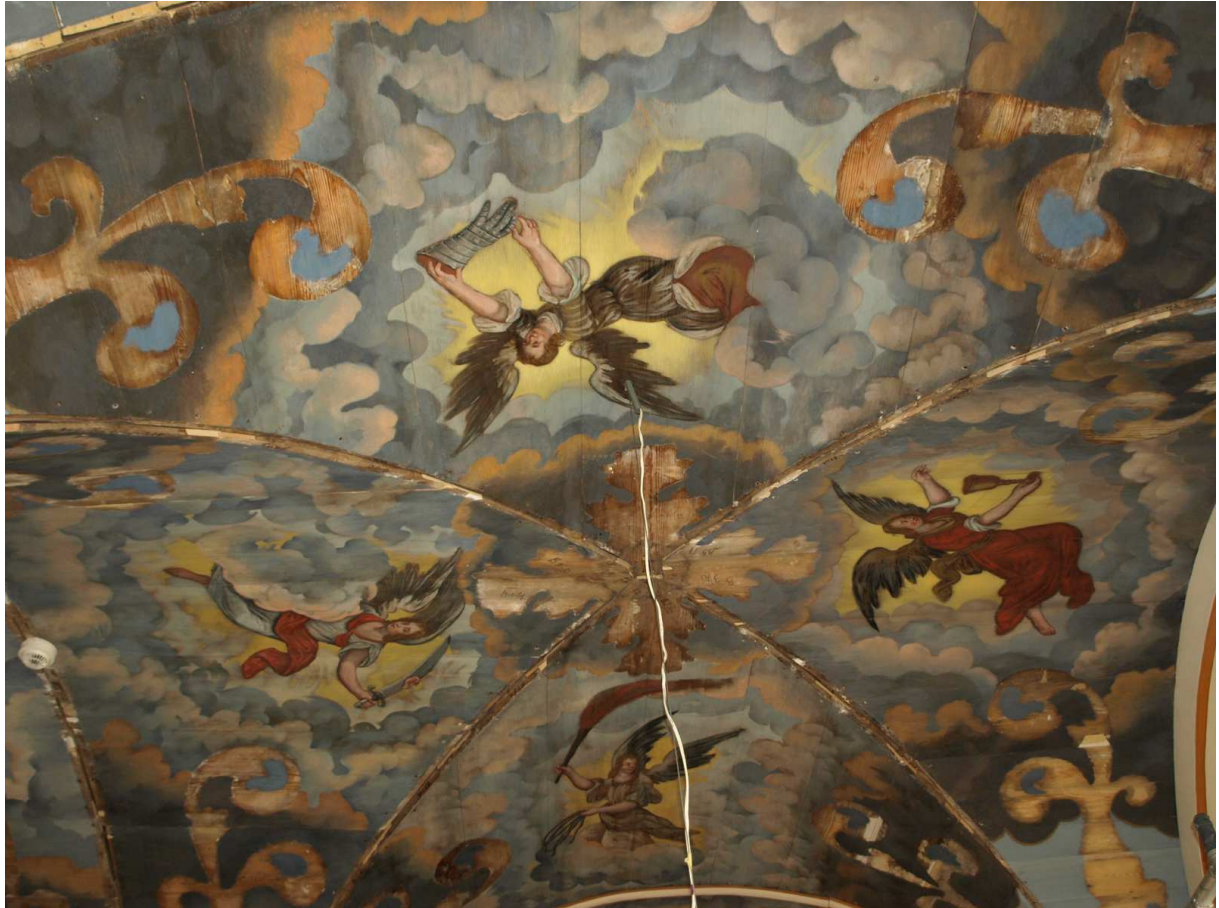
5. Etappe (2015), oben und unten: südl. Gewölbefeld des 4. Jochpaars von Osten nach Restaurierung, Dezember 2015