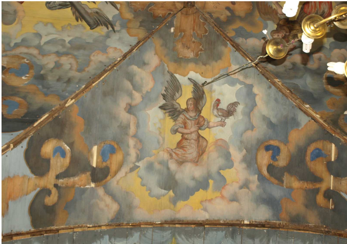
5. Etappe (2015): Kappe mit Hahn haltendem Engel im nördl. Gewölbefeld des 4. Jochpaars von Osten nach Restaurierung, Dezember 2015