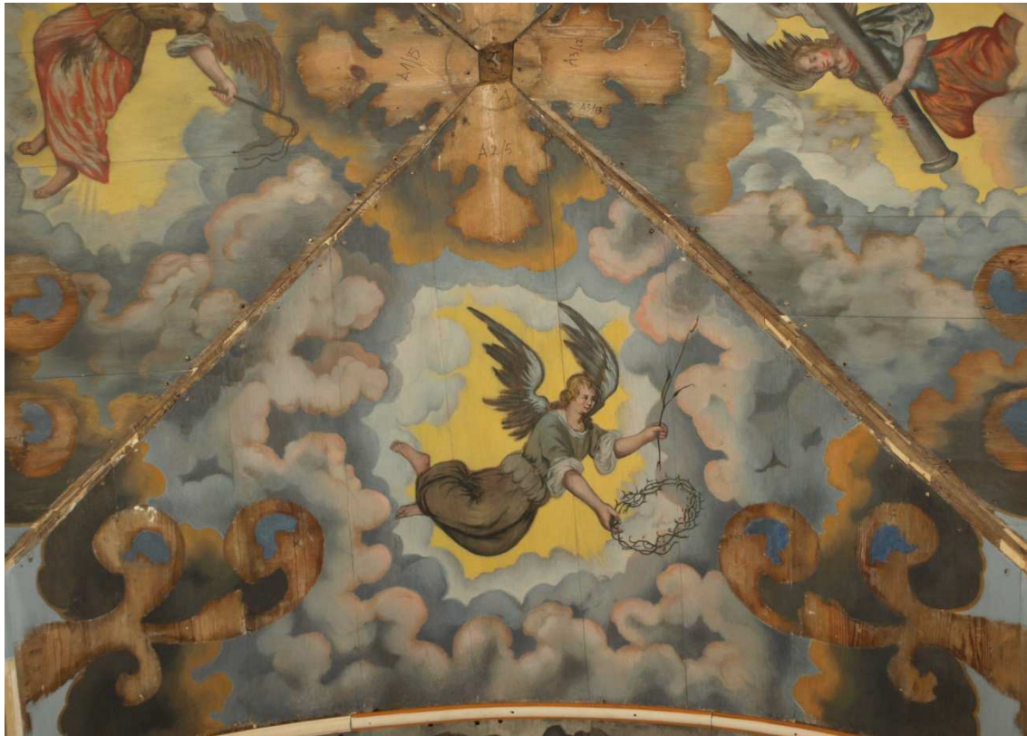
5. Etappe (2015), oben: Kappe mit Dornenkrone tragendem Engel unten: Kappe mit Engel, der eine Peitsche und ein Zweigbündelhält, jew. nördl. Gewölbefeld des 4. Jochpaares von Osten nach Restaurierung, Dezember 2015 (oben Foto T. Makulec)