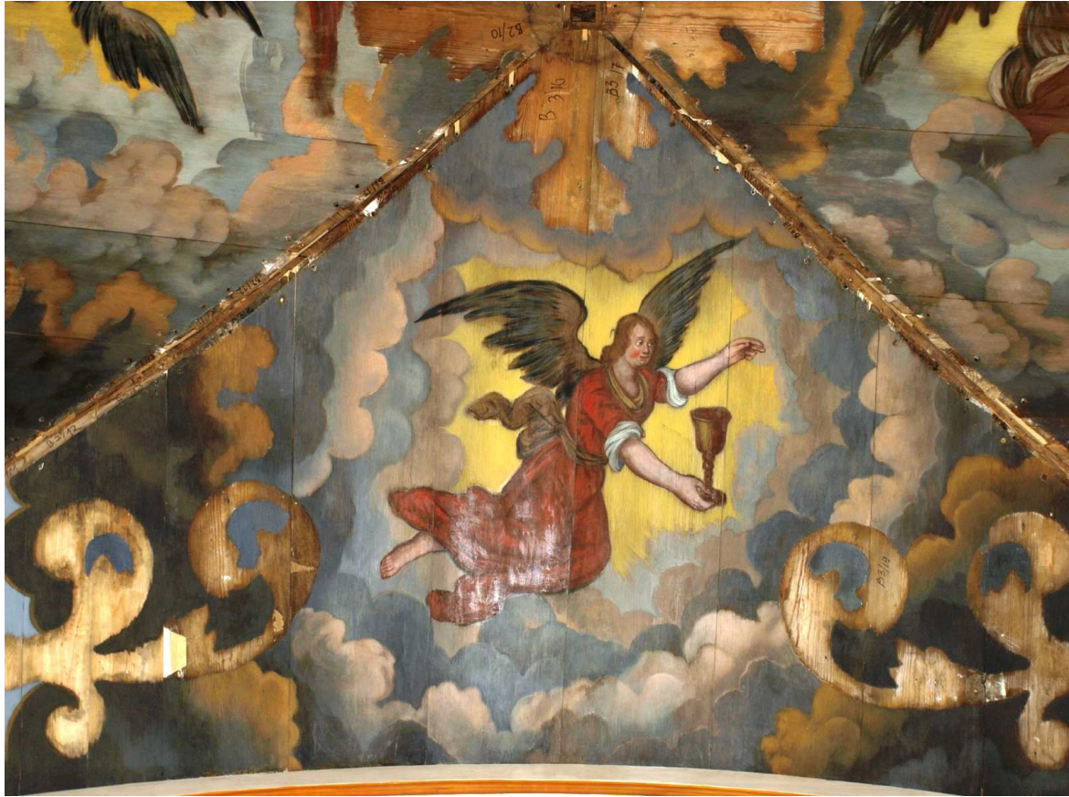
5. Etappe (2015), oben: Kappe mit Kelch haltendem Engel, unten: Kappe mit Fackel haltendem Engel, jew. südl.. Gewölbefeld des 4. Jochpaars von Osten nach Restaurierung, Dezember 2015