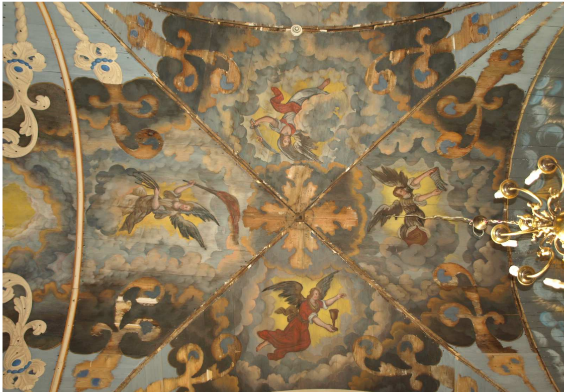
5. Etappe (2015): südl. Gewölbefeld des 4. Jochpaars von Osten nach Restaurierung, Dezember 2015 Fehlende Holzrippen und-schnitzschmuckelemente werden mit der Etappe 2016 fertig restauriert und wieder montiert)