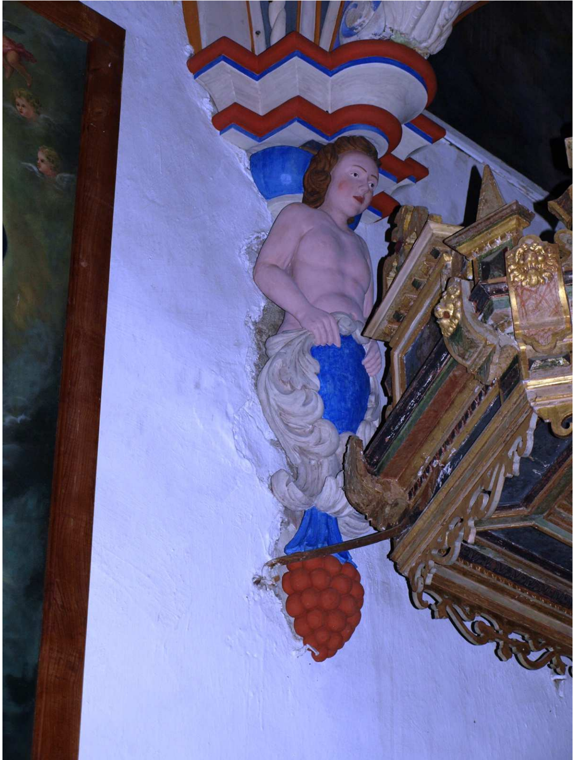
5. Etappe (2015): Gewölbekämpferfigur Südseite zwischen 2. und 3. Gewölbejochfeld nach Restaurierung, Dezember 2015