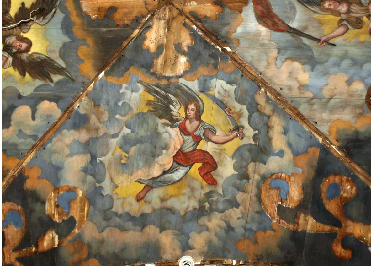
5. Etappe (2015), oben: Kappe mit Engel, der ein Krummschwert mit Malchus` Ohr hält Kelch, unten: Kappe mit Eisenhandschuh haltendem Engel, jew. südl.. Gewölbefeld des 4. Jochpaars von Osten nach Restaurierung, Dezember 2015