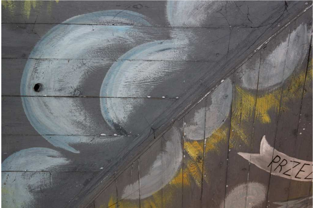
Ausschnitt nachkriegszeitliche Malerei des 5. Gewölbejochs von Osten, Dezember 2015