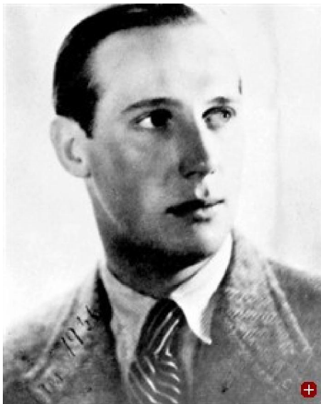
Heinrich Graf Lehndorff führte bis zum Attentat vom 20. Juli drei Jahre lang ein perfekt getarntes Doppelleben

20. Juli 2011 Wir haben jetzt in Ostpreußen eine wichtige Adresse“, schrieb Helmuth James von Moltke an seine Frau Freya. Steinort war tatsächlich für die Verschwörer des 20. Juli 1944 wichtig und als Treffpunkt geradezu ideal. Das Schloss lag sechs Kilometer von „Mauerwald“, dem Hauptquartier des Heeres, entfernt und nur vierzehn von der „Wolfsschanze“, dem Führerhauptquartier, und noch wichtiger, es war unverdächtig: In einem Flügel des imposanten Komplexes hatte sich der Außenminister Joachim von Ribbentrop mit seinem Stab luxuriös einquartiert, im anderen wohnte weiterhin der junge Gutsbesitzer und Reserveoffizier Heinrich Graf Lehndorff mit seiner Frau Gottliebe und den drei kleinen Töchtern. Er war als Ordonnanzoffizier von Generalfeldmarschall von Bock in die Attentatspläne eingeweiht und der wichtigste Kurier zwischen Stauffenberg, Tresckow und dem