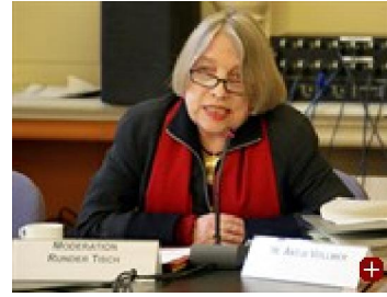
Antje Vollmer: "Wir brauchen das Wissen, dass es auch einige Mutige gab, die handelten und Verantwortung für den Lauf der Welt übernahmen"