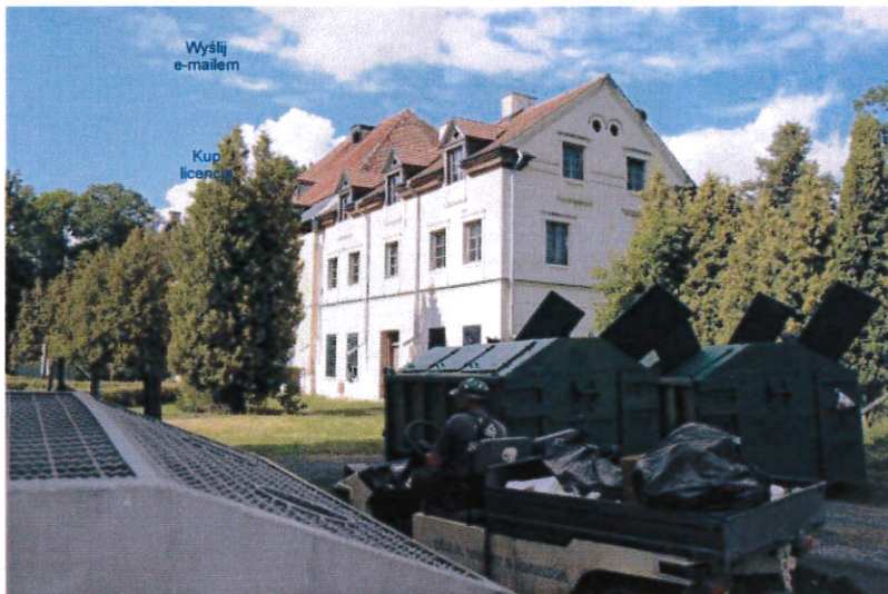
Zespół pałacowy w Sztynorcie

Rodzima część zarządu Polsko-Niemieckiej Fundacji Ochrony Zabytków Kultury zgodziła się na przejęcie od starostwa węgorzewskiego kolejnej części zabytkowej posiadłości Lehndorffów w Sztynorcie.