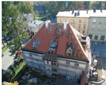
Dachaufsicht mit neu gemauerten Schornsteinköpfen und rechts mit zusätzlich angebrachten neuen Öffnungen, jeweils Spätsommer 2014