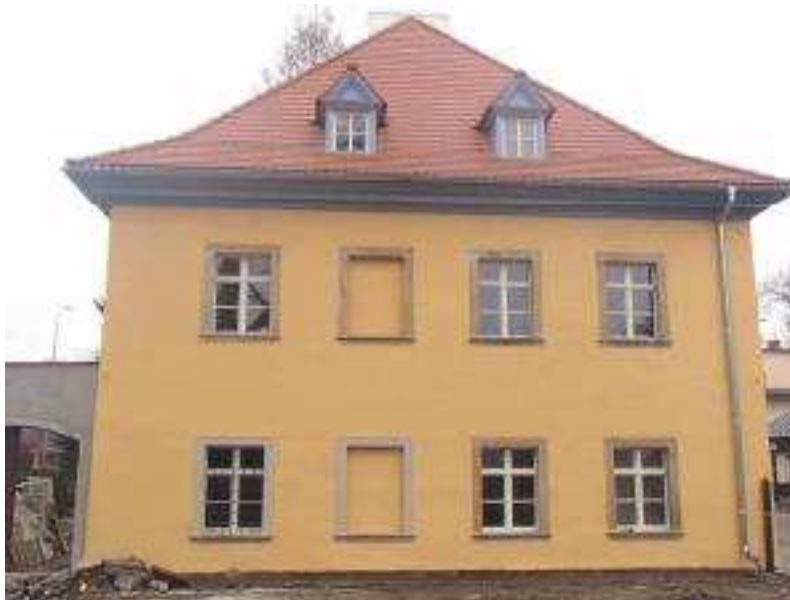
Westansicht nach Fertigstellung Dach- und Fassadeninstandsetzung, November 2014