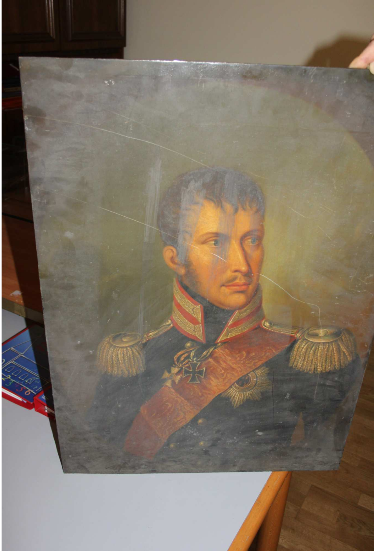
Auf dem Dachboden unter Schutt entdeckte Porträtdarstellung des preußischen Königs Friedrich Wilhelm III., November 2014