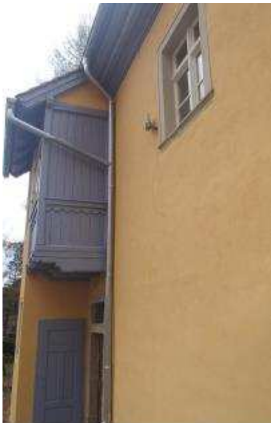
Ausschnitt sanierte Nordfassade mit Holzerker, Dezember 2014