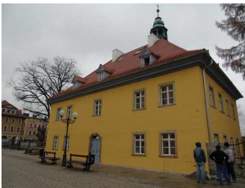
Südostansicht nach Fertigstellung Dach- und Fassadeninstandsetzung, Dezember 2014