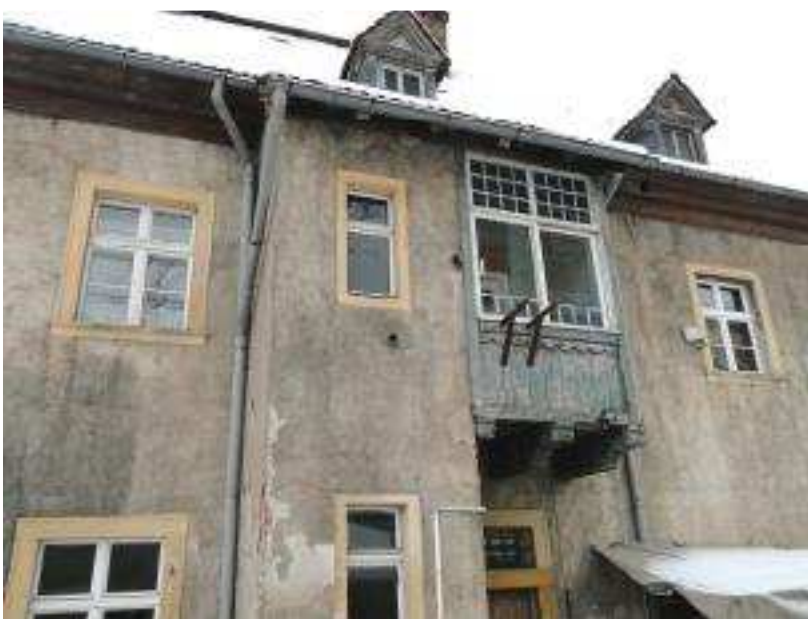
Nordfassade mit Holzerker vor der Sanierung, Februar 2014