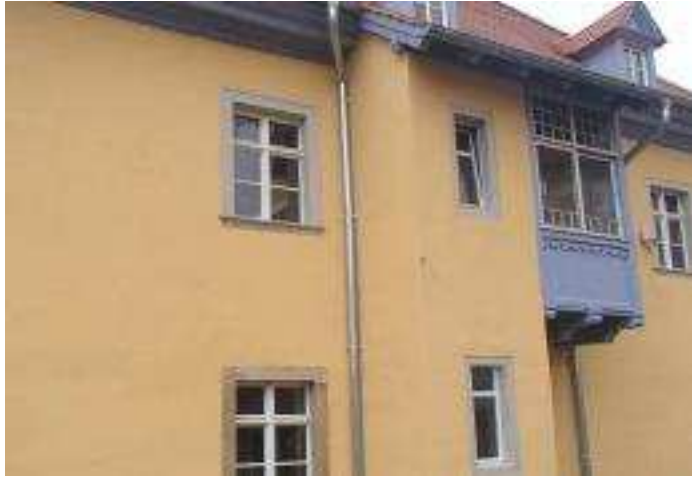
Ausschnitt sanierte Nordfassade mit Holzerker, Dezember 2014