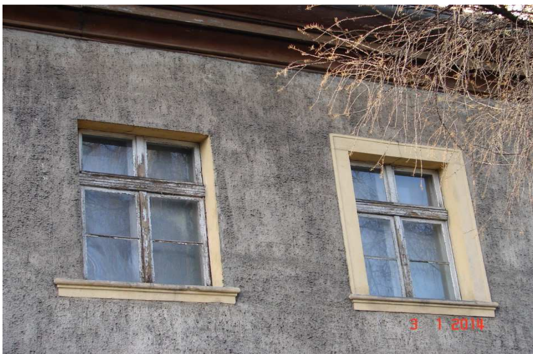
Verschlossene Holzfenster im Obergeschoss, Januar 2014