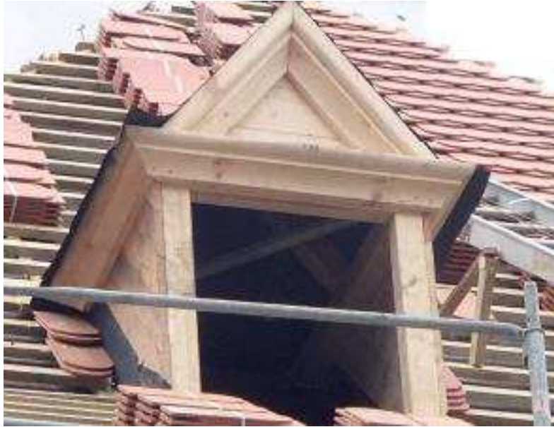
Erneuerte Dachgaube Dachsüdseite, Spätsommer 2014