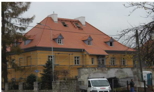
Nordostansicht nach Fertigstellung Dach- und Fassadeninstandsetzung, Dezember 2014