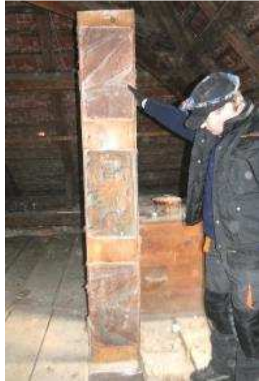
Instandzusetzender Holzerker, Februar 2014 und bemaltes Holzdeckenbrett, Herbst 2014