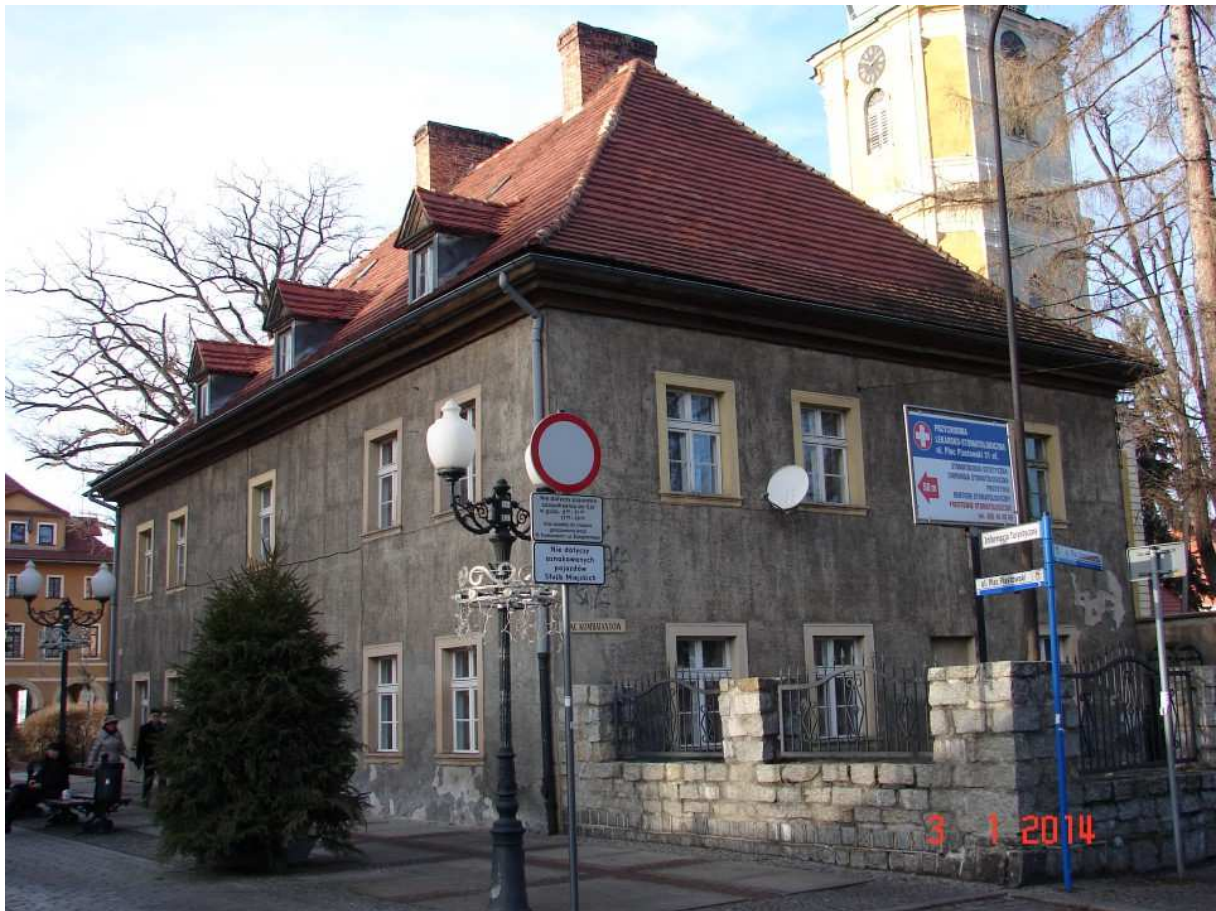
Südostansicht, Zustand im Januar 2014