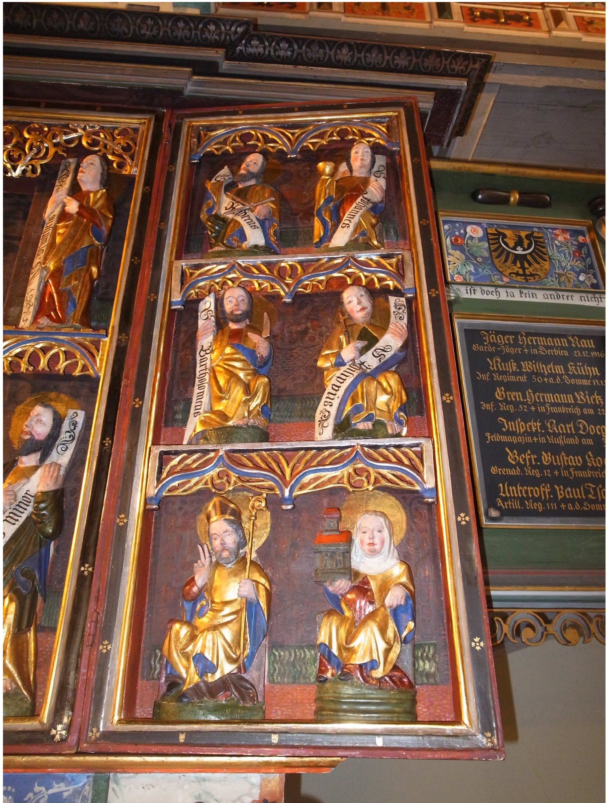
Rechter Seitenflügel des gotischer Altar in aufgeklapptem Zustand nach Fertigstellung Konservierung und Restaurierung, November 2013