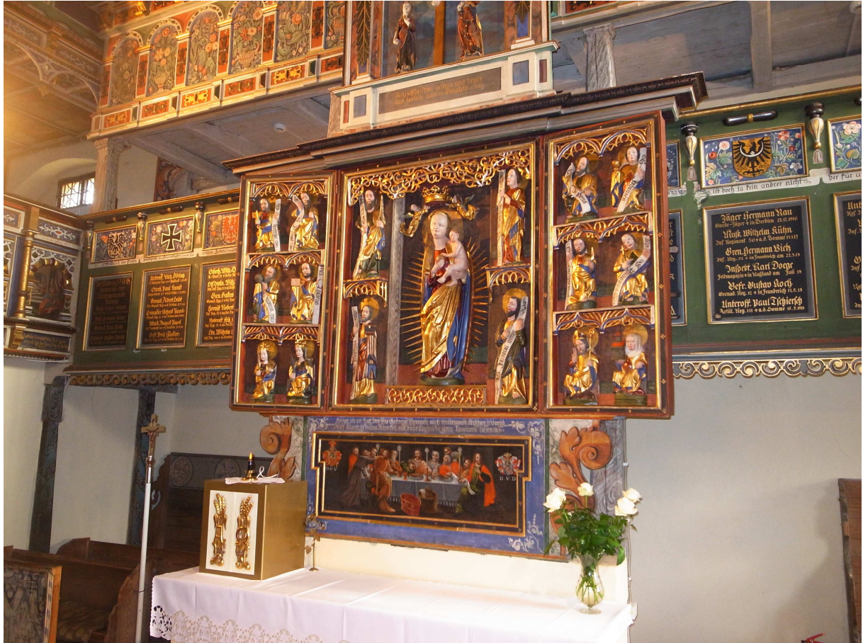
Gotischer Altar nach Fertigstellung Konservierung und Restaurierung, November 2013