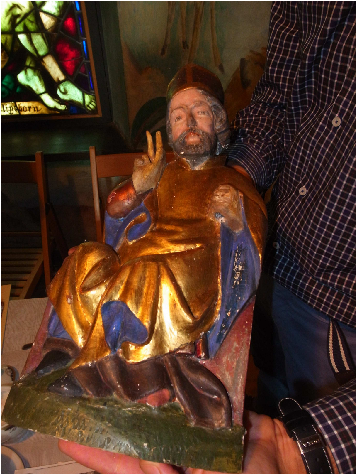
Gotischer Altar: ausgebaute Bischofffigur rechter Seitenflügel (u.l.). Sommer 2013

Fotos, die zu dem DPS-Förderprojekt Römisch-Katholische Filialkirche „Heimsuchung der Jungfrau Maria“ in Klemzig/Kłępsk (Polen) im Zeitraum 2012 bis 2013 entstanden sind – Teil 5