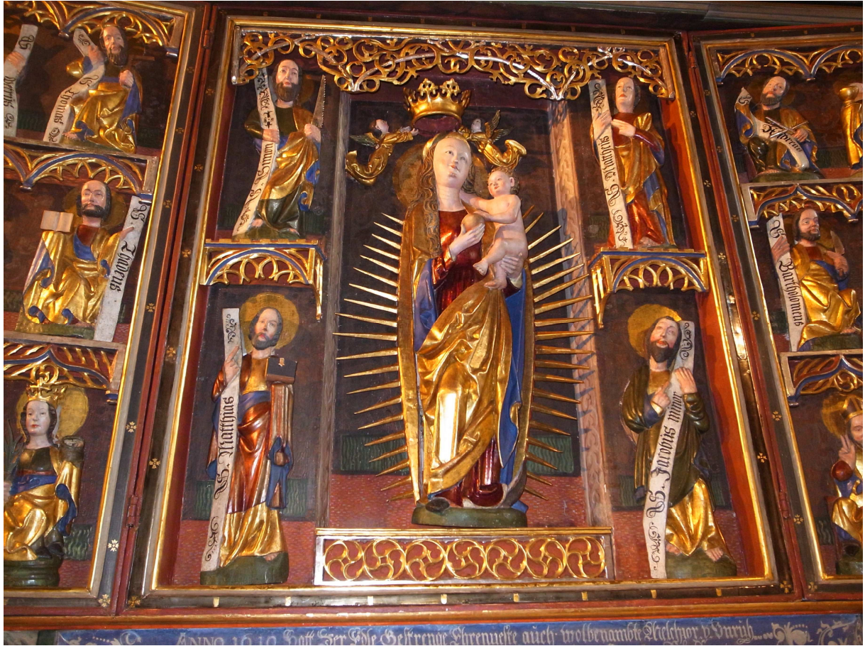
Gotischer Altar in aufgeklapptem Zustand nach Fertigstellung Konservierung und Restaurierung, November 2013