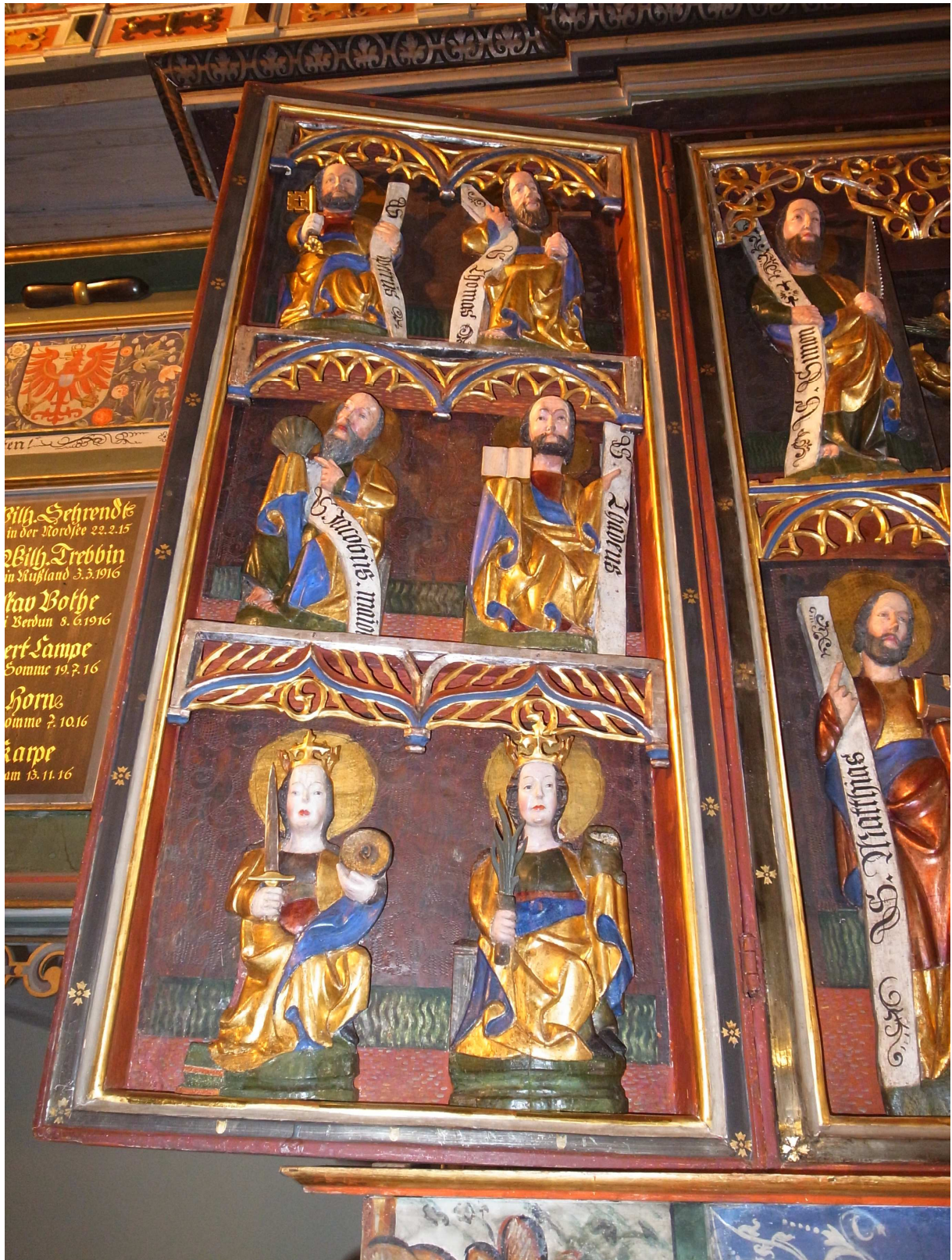
Linker Seitenflügel des gotischer Altar in aufgeklapptem Zustand nach Fertigstellung Konservierung und Restaurierung, November 2013