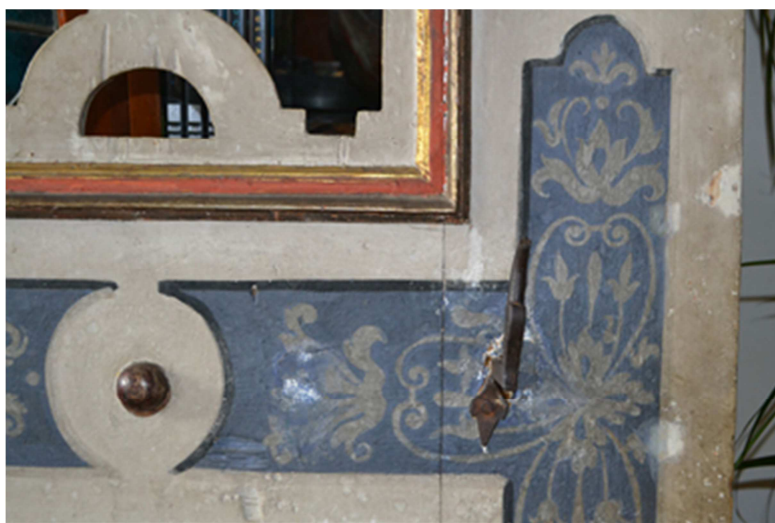
. Die Kanzel (Türen) vor der Konservierungsarbeit, 2012