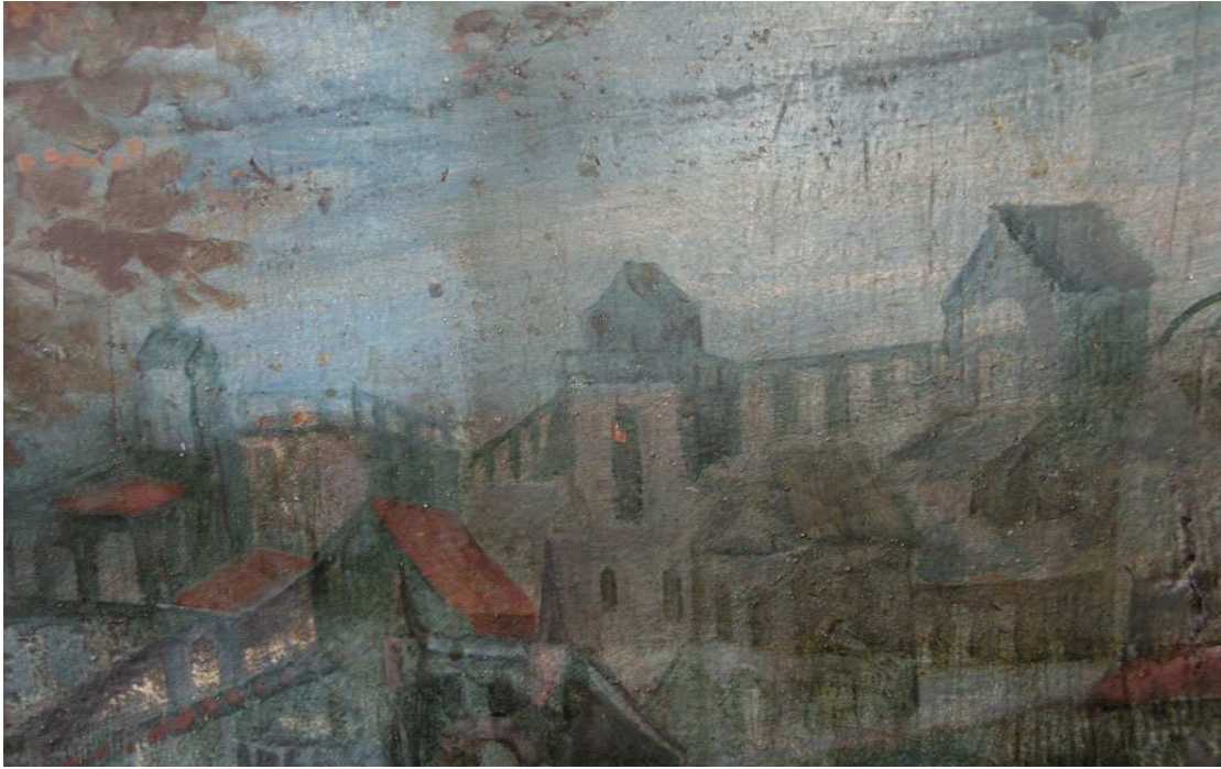
Kanzelsichtflächen während der Reinigung, 2013