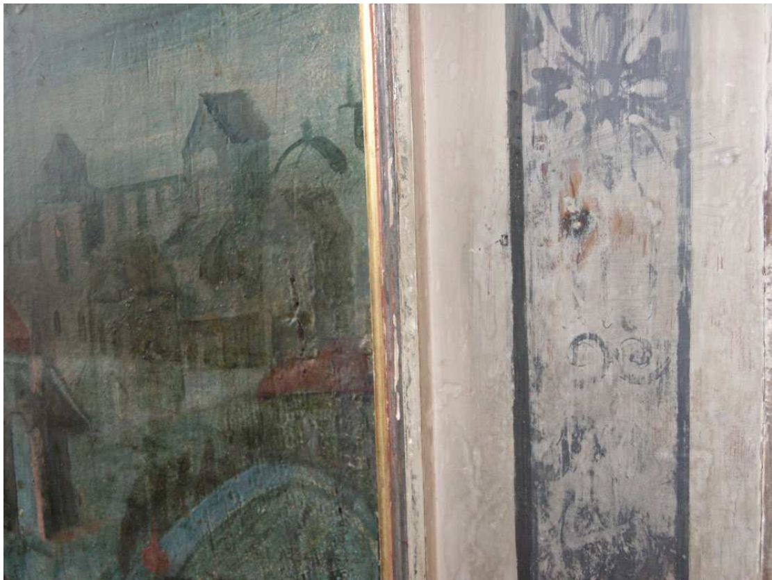
Kanzelteile vor der Konservierung und Restaurierung, 2012