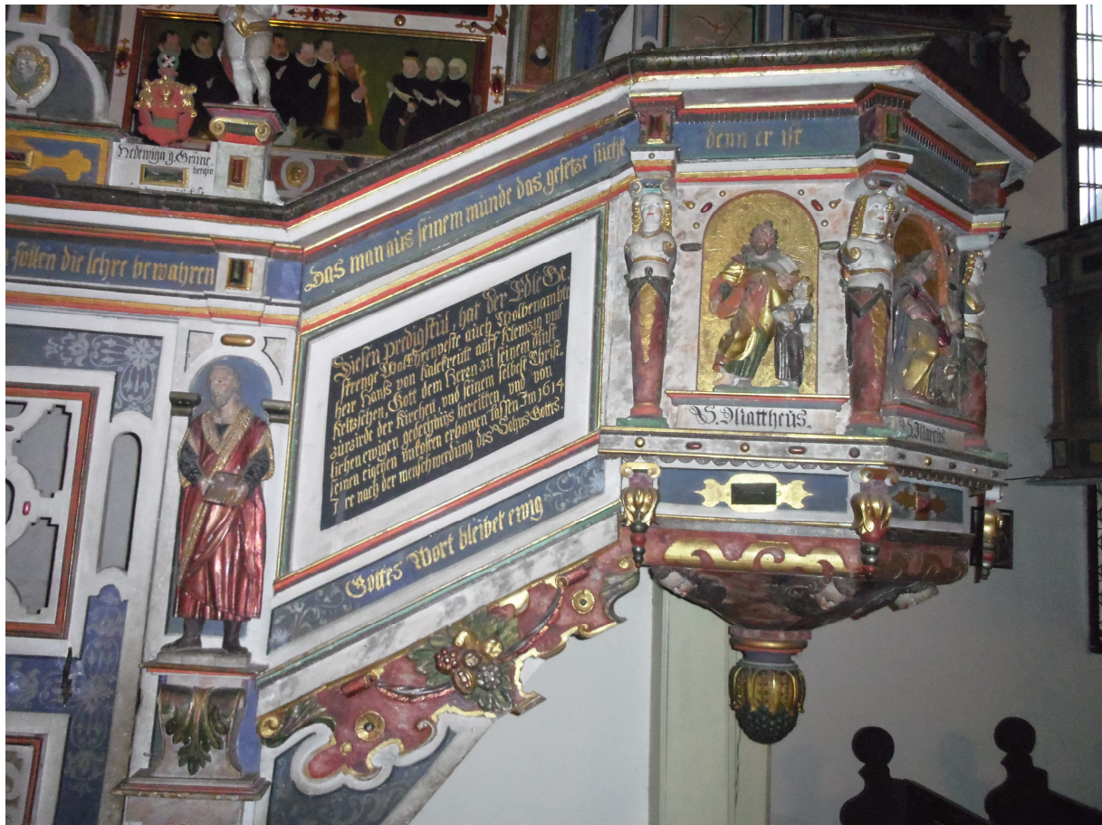
Renaissancekanzel vor der Restaurierung. Frühjahr 2012