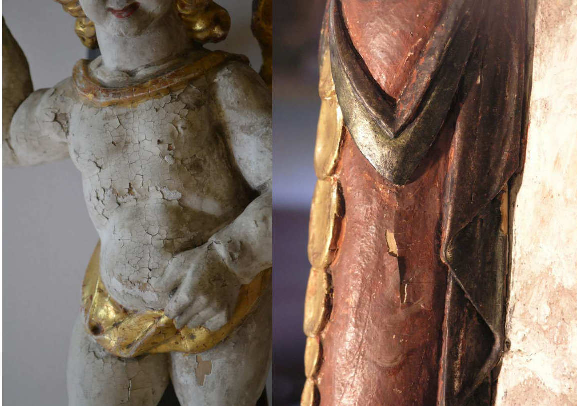
Renaissancekanzel 2012: Sichtbare Fehlstellen und Ablösungen der Malschicht vom Holzträger

Kanzelteile vor der Konservierung und Restaurierung, 2012