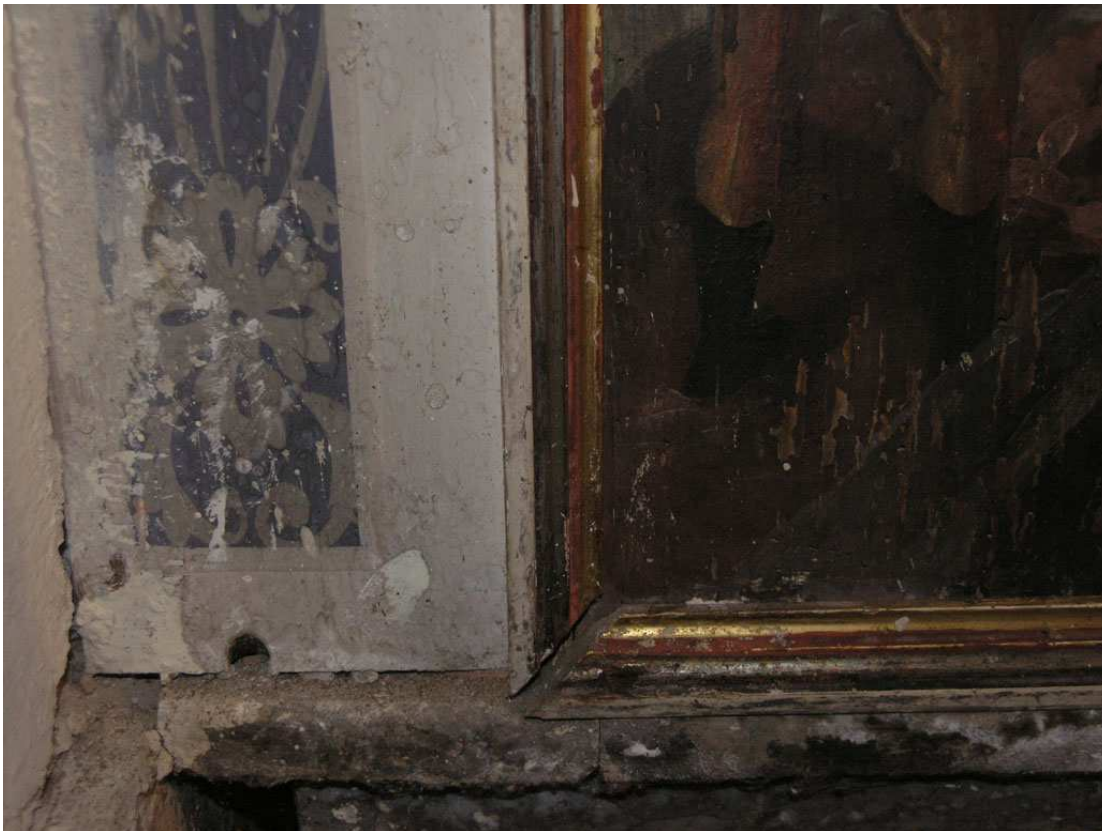
Unterer Kanzelteil vor der Konservierung und Restaurierung, 2012