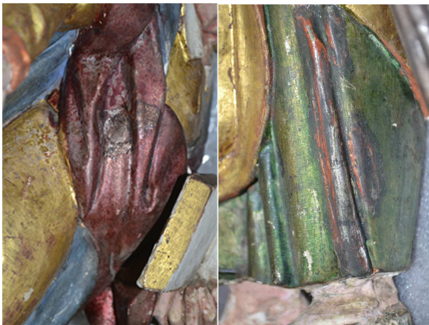
Renaissancekanzel: Unter Versilberung und polychromer Lasur sichtbare Schadstellen, 2012