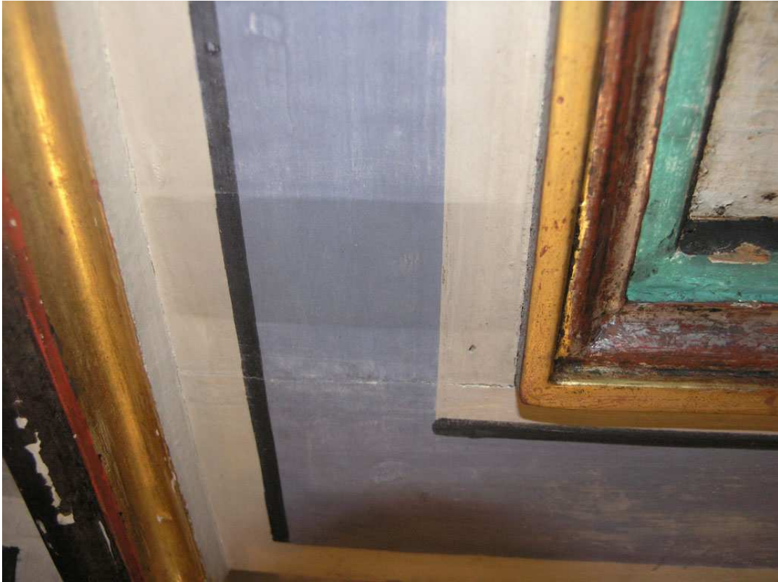
Kanzelsichtfläche während der Reinigung, 2013