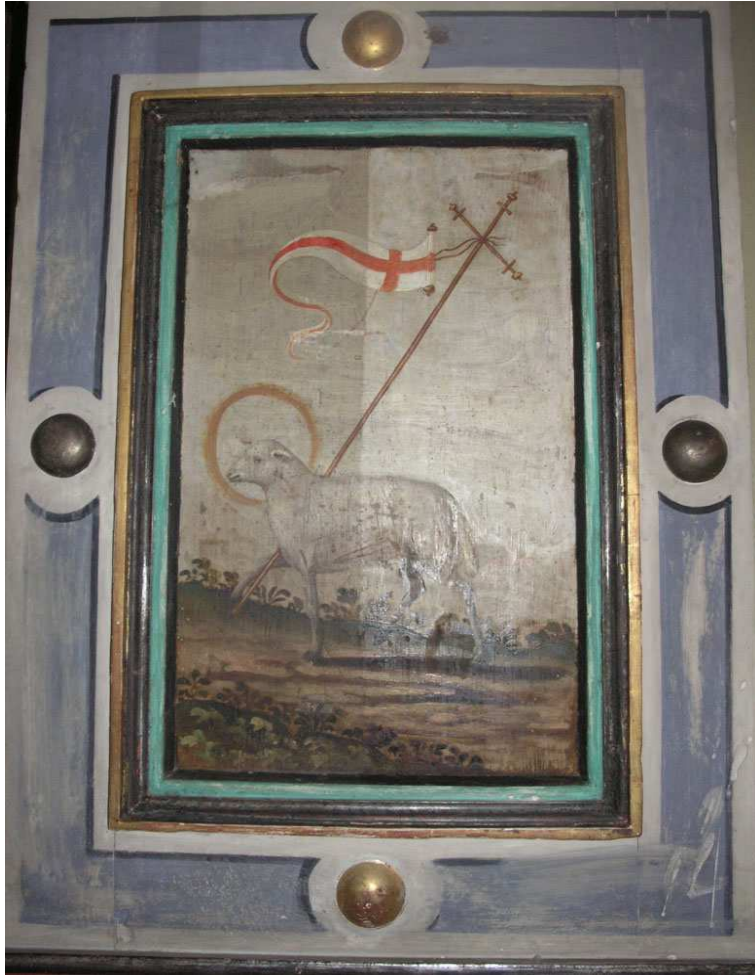
Kanzelsichtflächen während der Reinigung, 2013