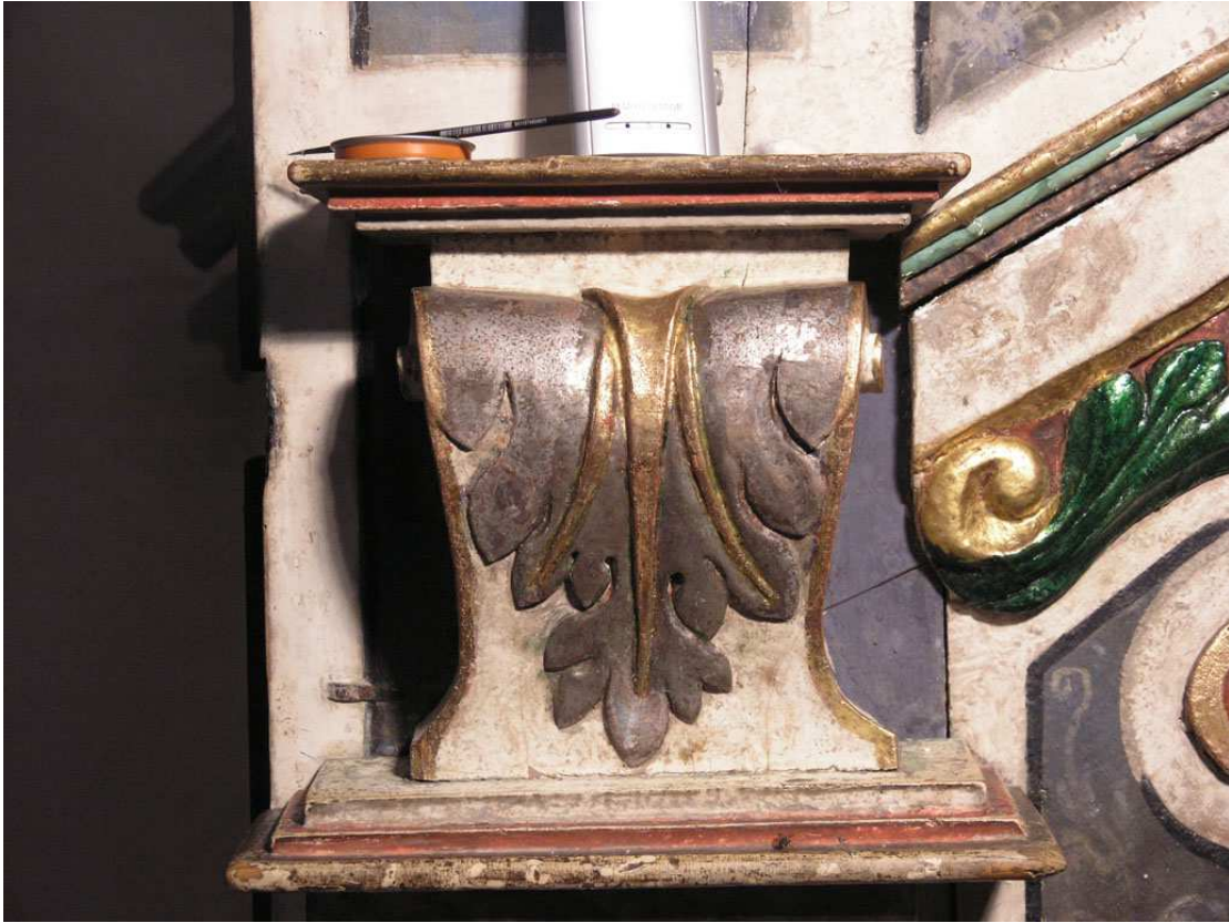
Kanzeldetail nach Fehlstellenschließung und Aufstockung der Versilberung, 2013