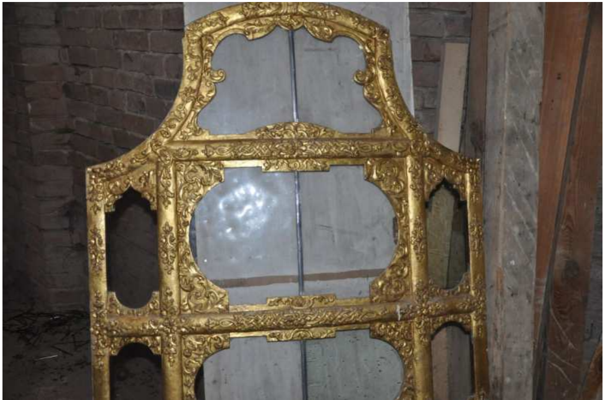
Ehem. Klosterkirche, Hauptaltar, Tabernakel, Schrankfensterelement, November 2014