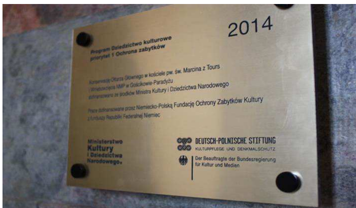
Ehem. Klosterkirche, Hauptaltar, Fördertafel 2014, November 2014