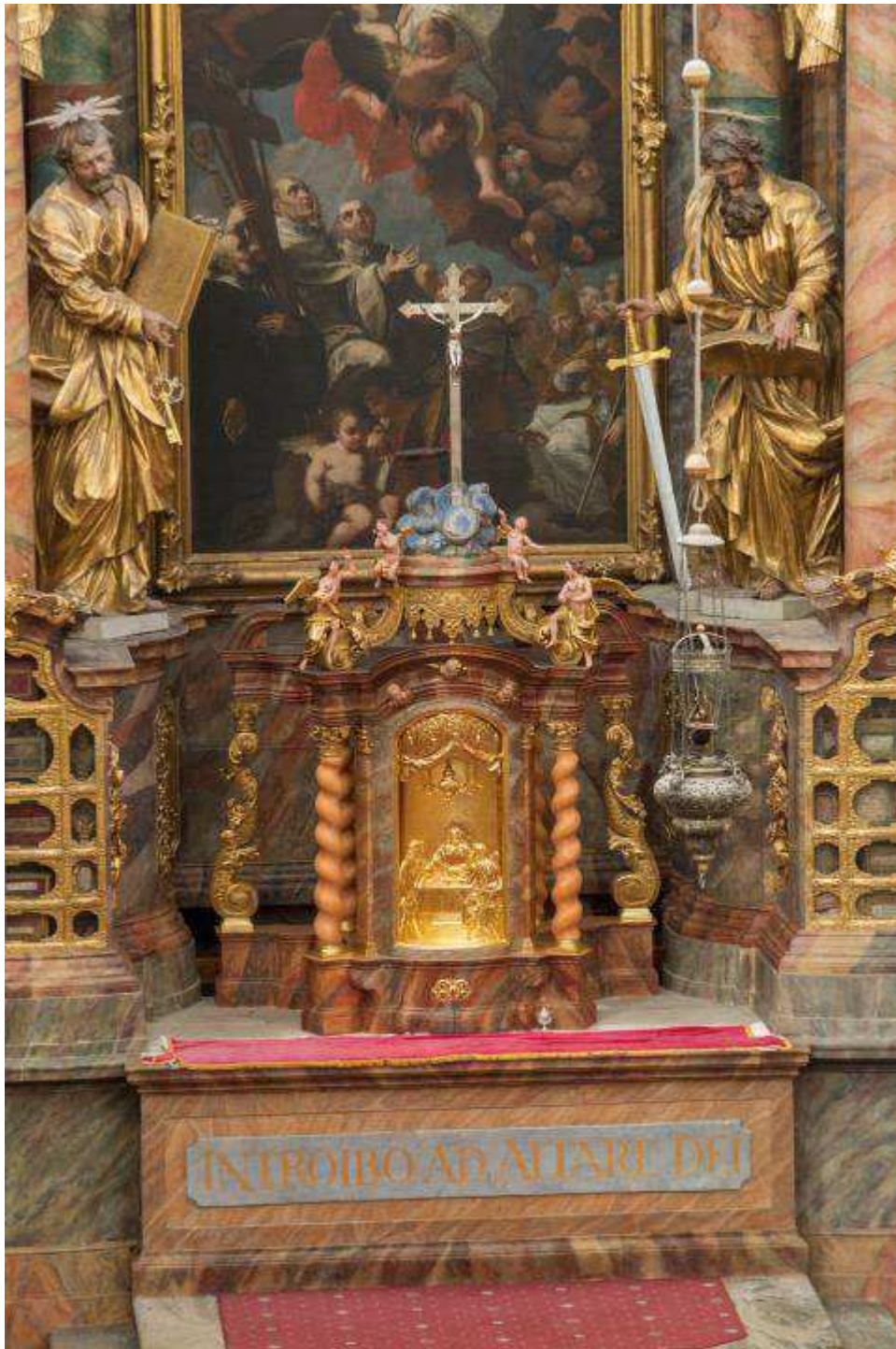
Ehem. Klosterkirche, Hauptaltar, Tabernakel nach erfolgter Restaurierung, November 2014