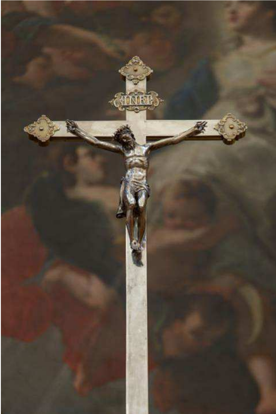
Ehem. Klosterkirche, Hauptaltar, Tabernakel, restauriertes Kruzifix, November 2024