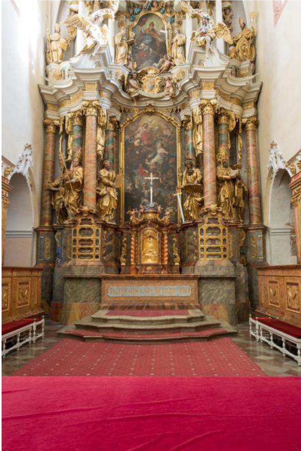
Ehem. Klosterkirche, Hauptaltar nach erfolgter Restaurierungsetappe 2014, November 2014