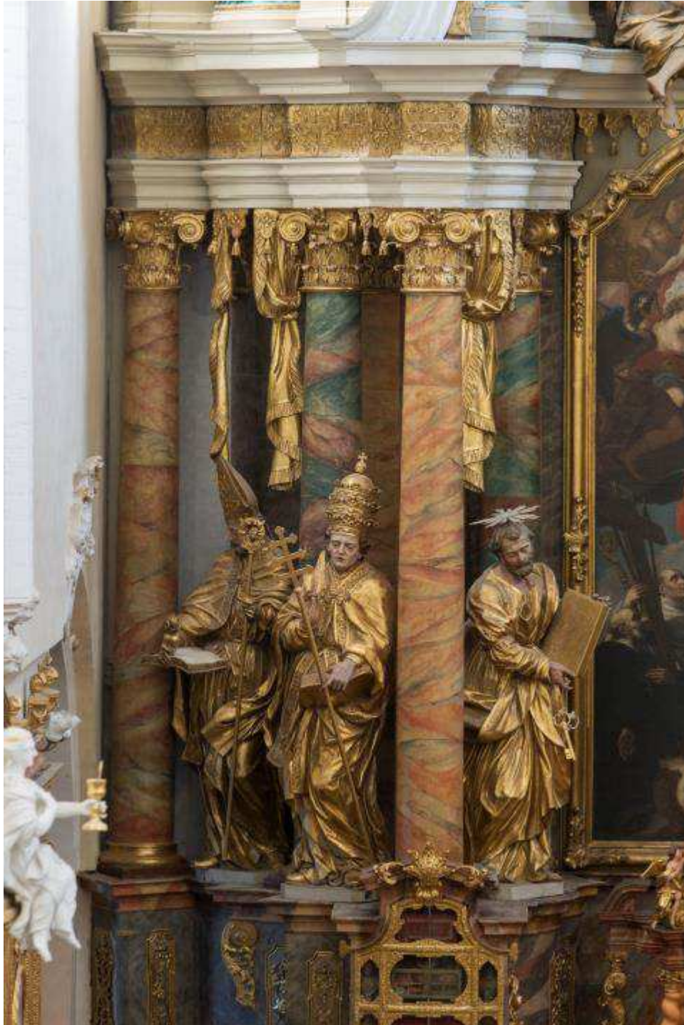
Ehem. Klosterkirche, Hauptaltar unterer Teil, restaurierte linke Figurengruppe, November 2014