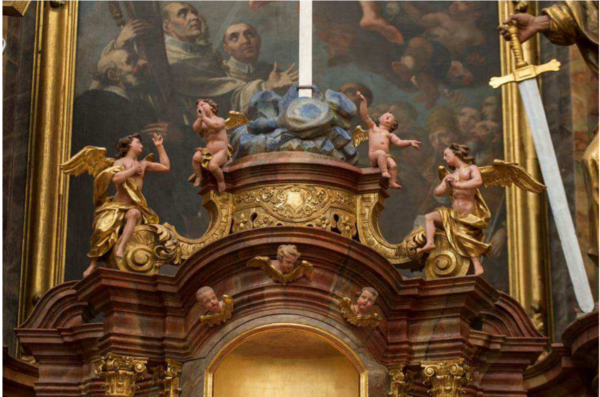
Ehem. Klosterkirche, Hauptaltar, Tabernakel, restaurierte Bekrönung, November 2014