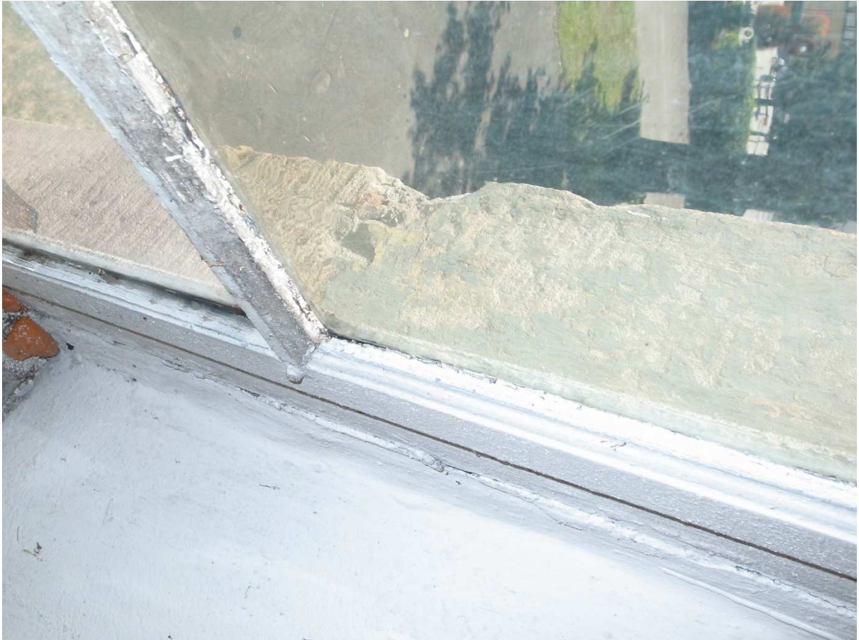
Restaurierungsbedürftiger Fensterflügel Schiff, August 2012