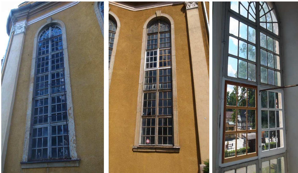
Schiff-Fenster Südseite –in der Mitte und rechts außen mit zwei Musterfeldern, August 2012