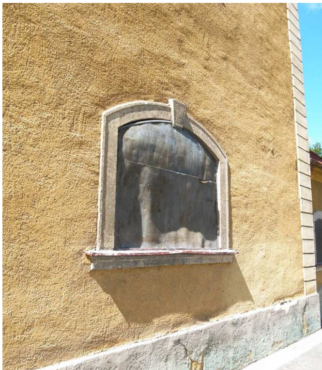
Von außen provisorisch geschlossenes Sakristeifenster, August 2012