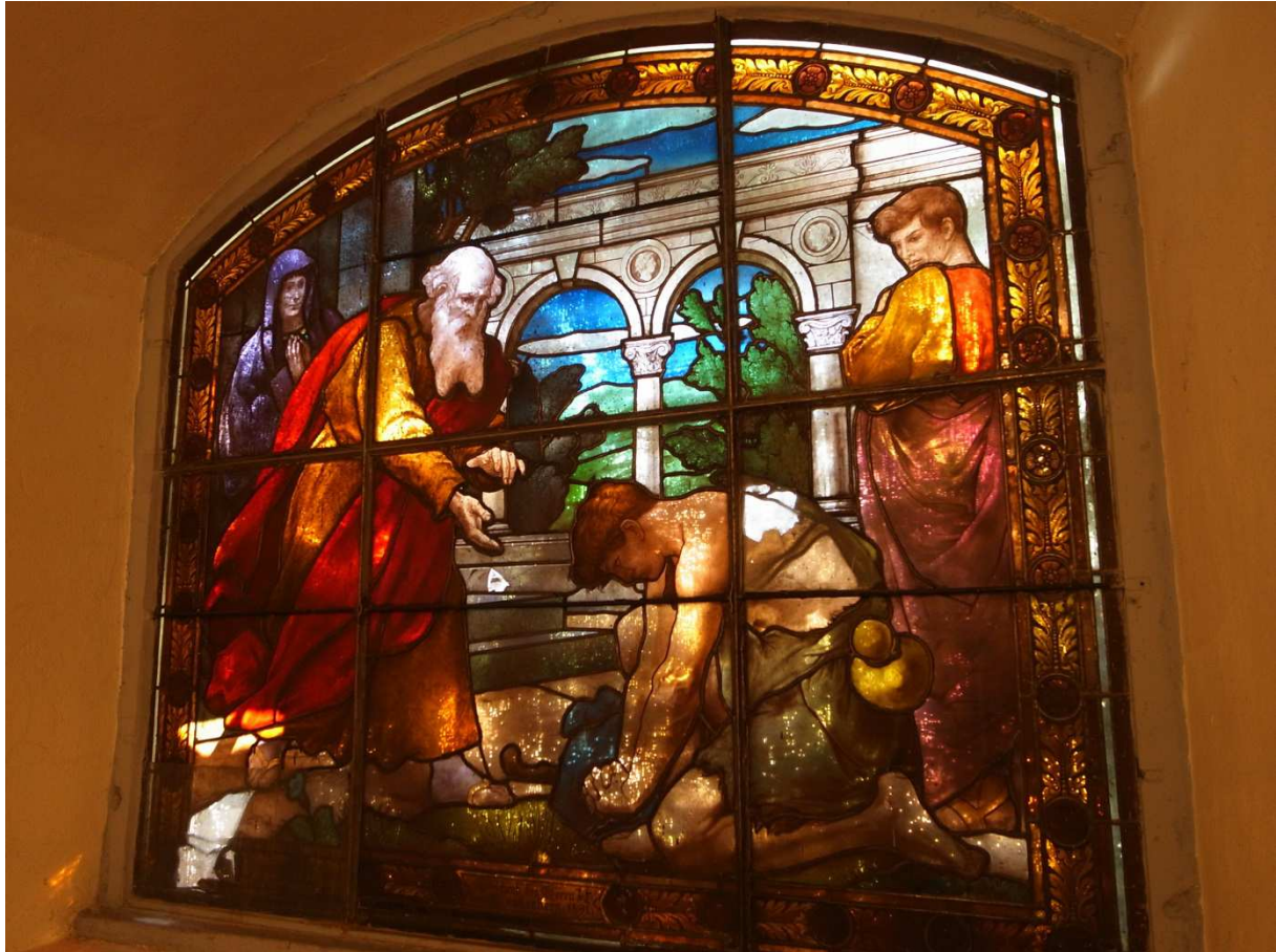
Sakristeifenster, August 2012