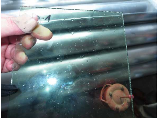
Vergleich neuer Scheibenproben (sog. Goetheglas) mit bauzeitlichem Fensterglas, August 2012