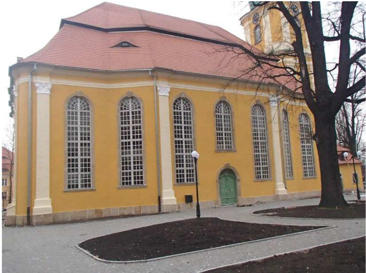
Südansicht von Westen nach der Fassadeninstandsetzung, Dezember 2014