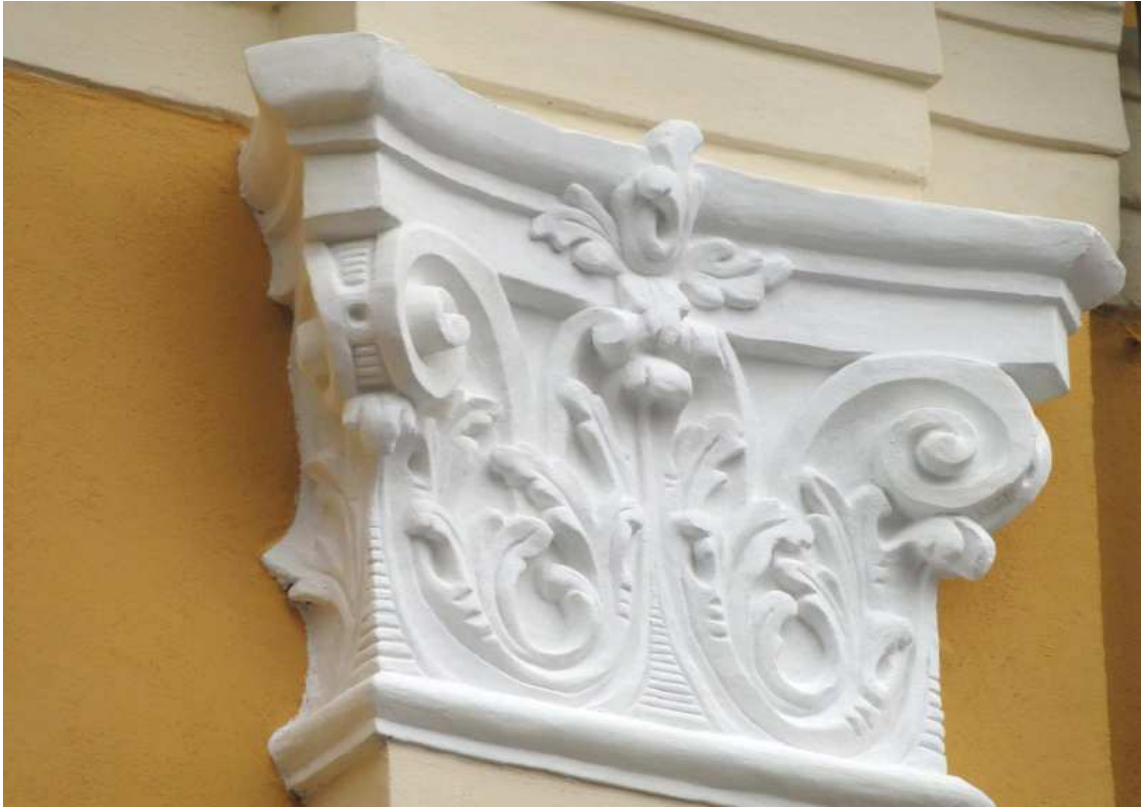
Restauriertes Kapitell Schiff-Fassade, Spätherbst 2014