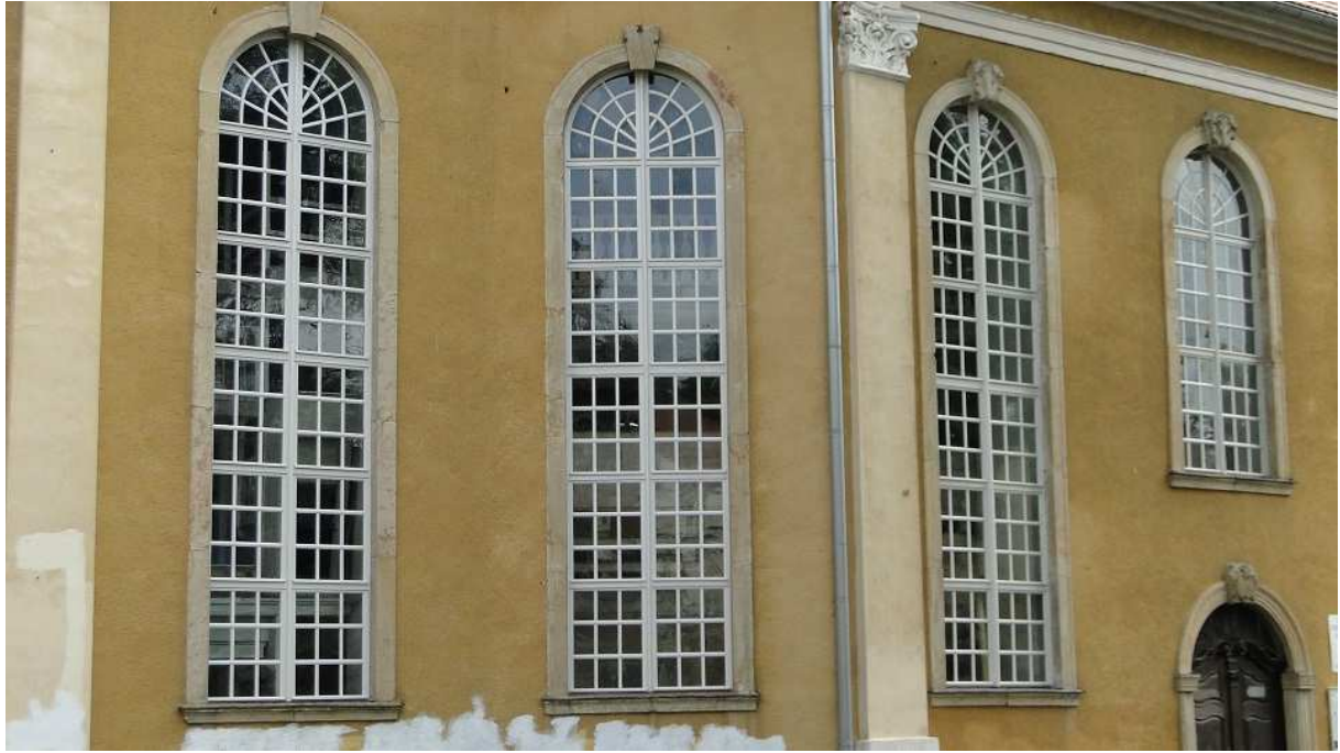
Südseite Schiff nach Fensterrestaurierung Etappe 1, 2011