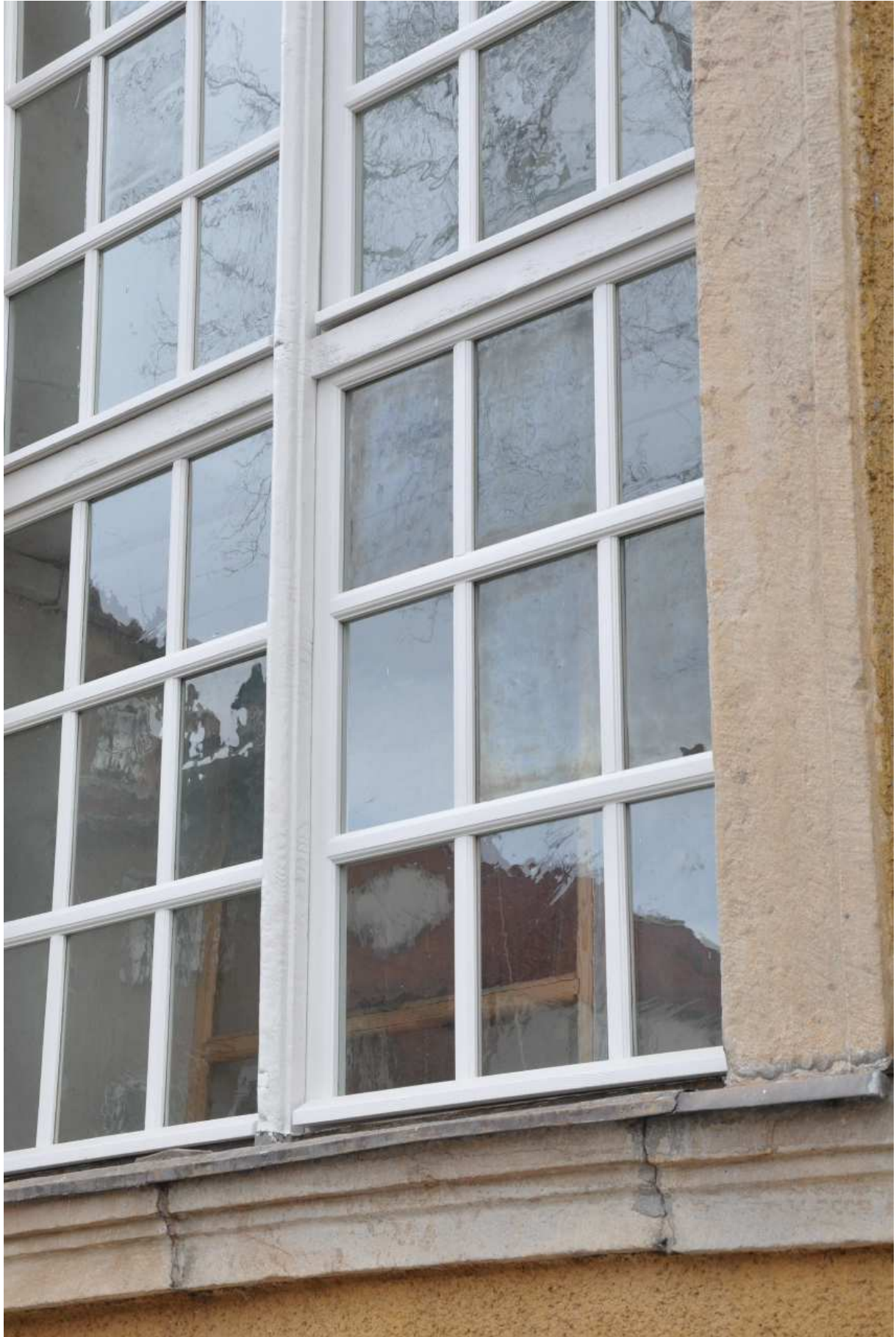
Ausschnitt aufgearbeitetes Schiff-Fenster, 2013