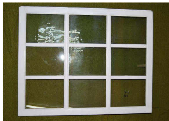
Fensterteil Schiff vor und nach Restaurierung, Ende 2012