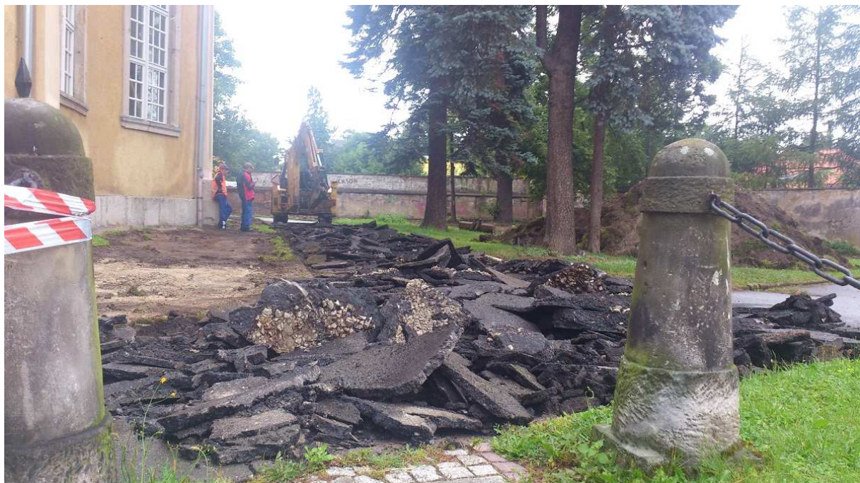
Nordseite Pfarrgarten nach Beginn der Sanierung der Außenanlagen, Sommer 2014