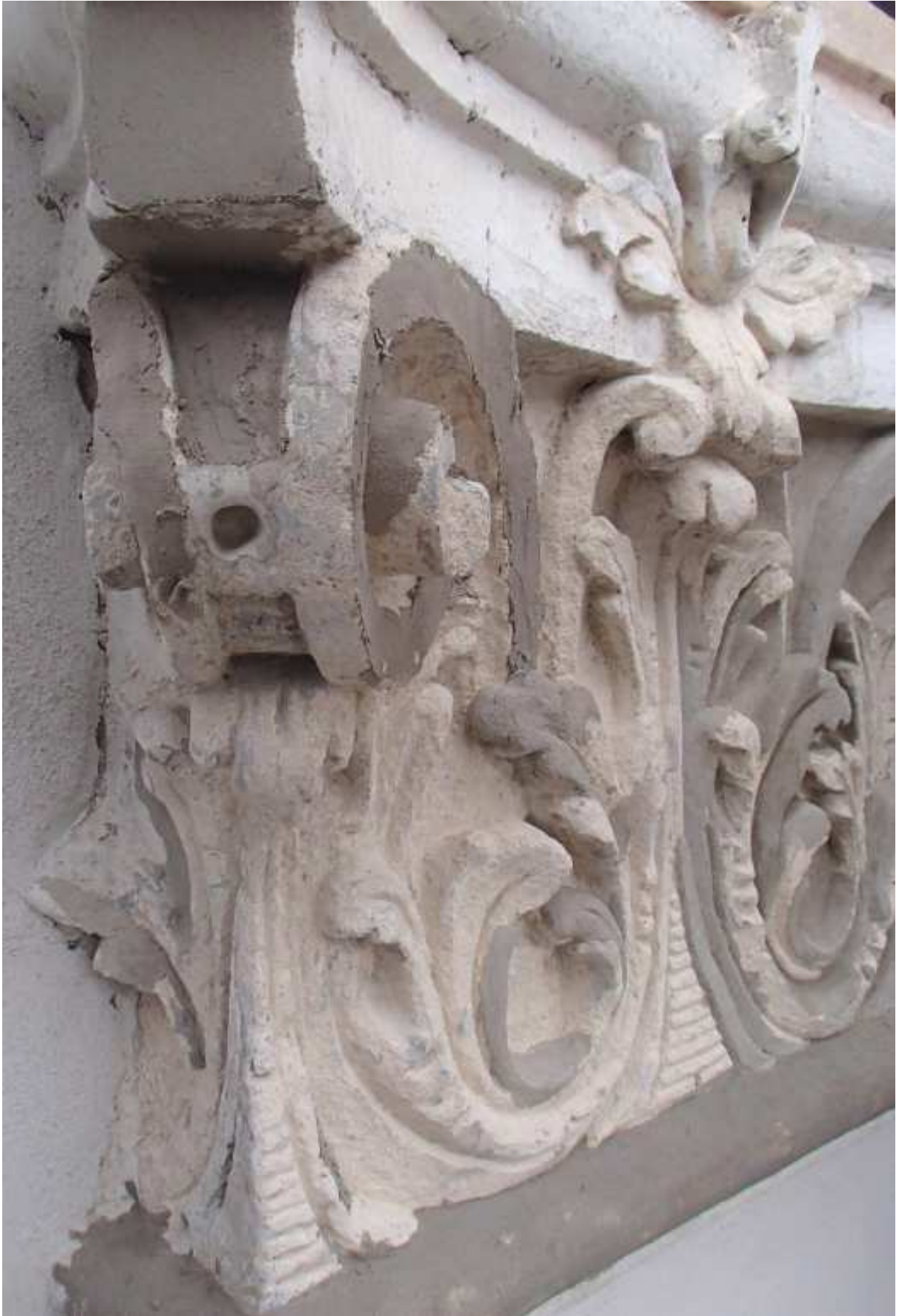
Verwittertes Sandsteinkapitell Schiff-Fassade, Sommer 2014