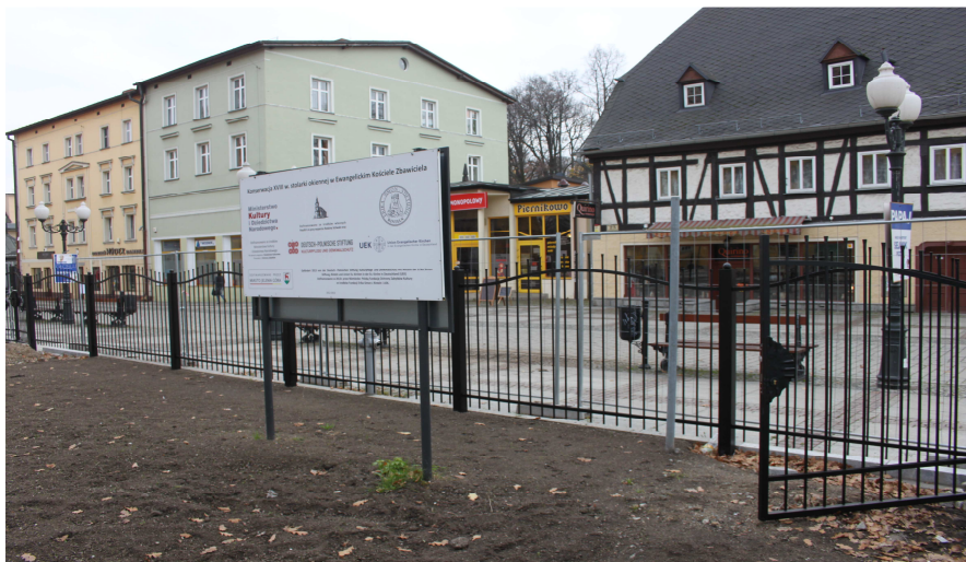
Neuer Metallzaun an der Plac Piastowski, November 2014