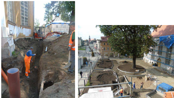
Drainagearbeiten an der Südseite des Pfarrgartens, Sommer 2014