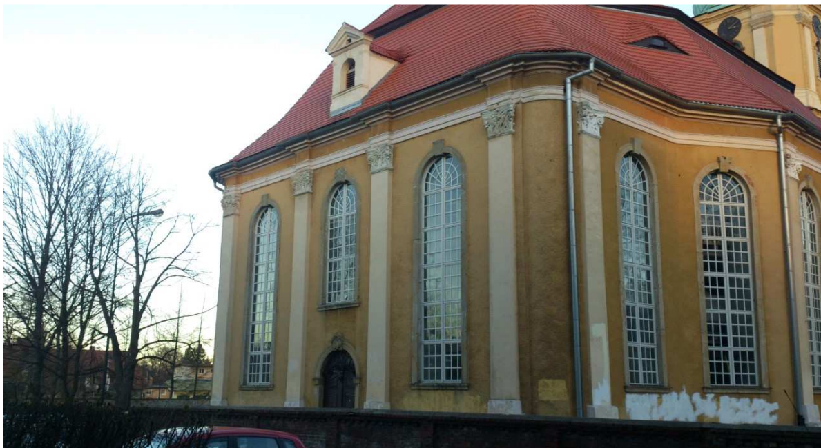
Westfassade Schiff nach Fensterrestaurierungsetappe 3, Ende 2013