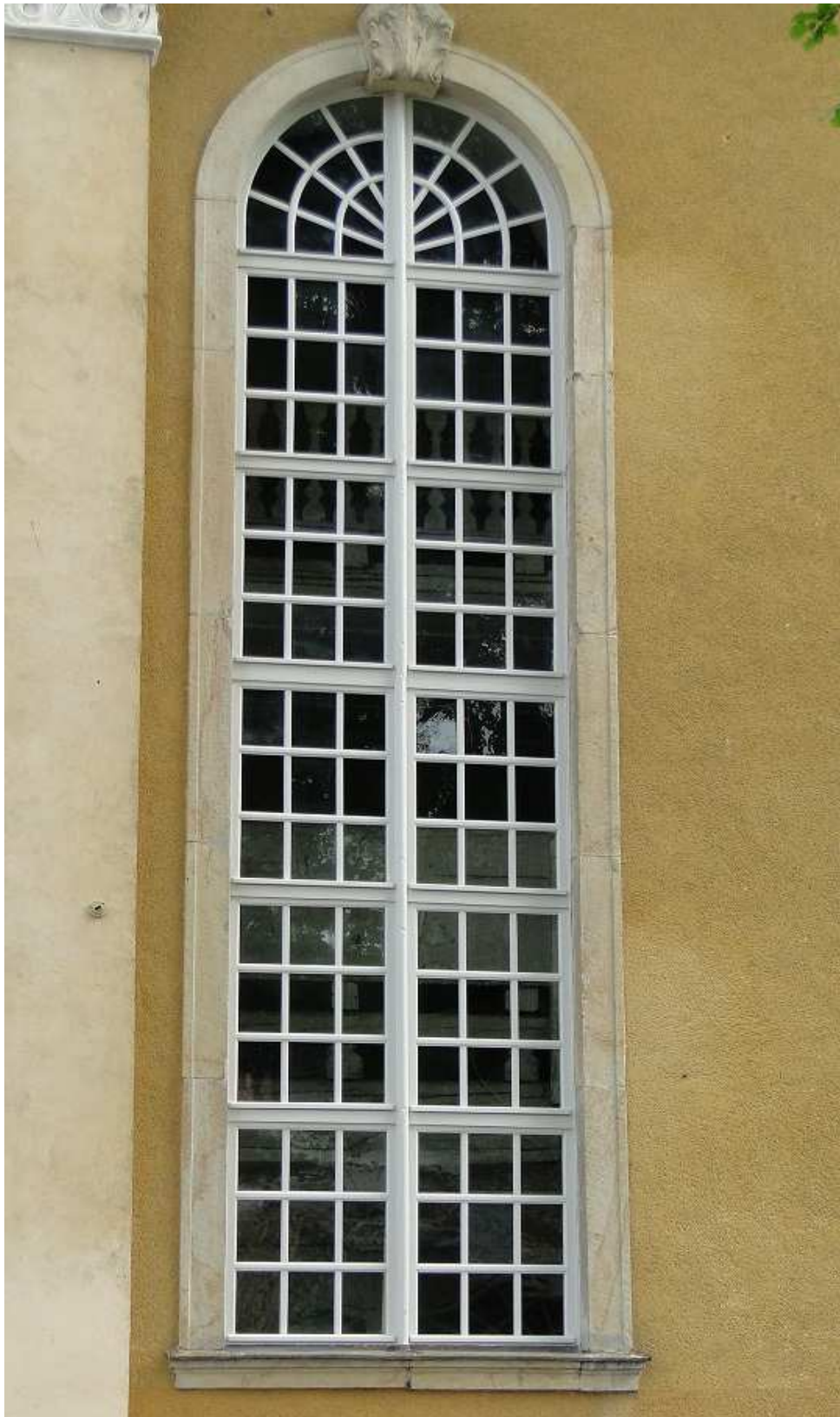
Restauriertes Fenster Südseite Schiff - Etappe 1. 2011