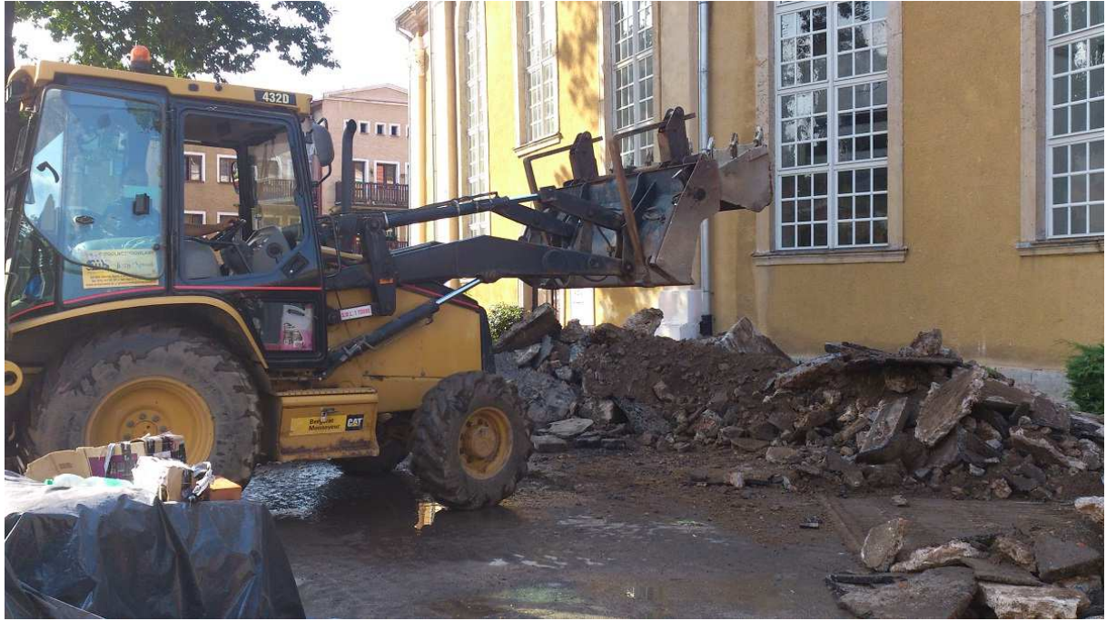
Südseite Pfarrgarten nach Beginn der Sanierung der Außenanlagen, Sommer 2014