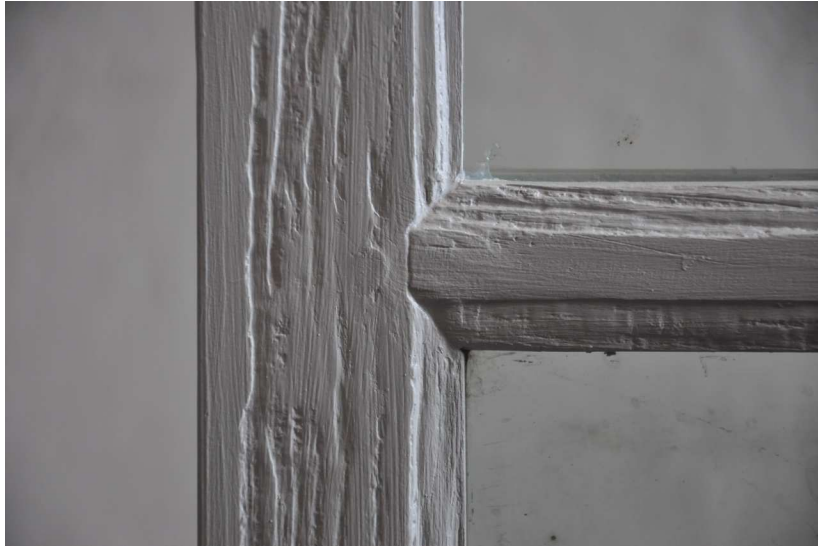
Ausschnitt repariertes Schiff-Fenster, 2013