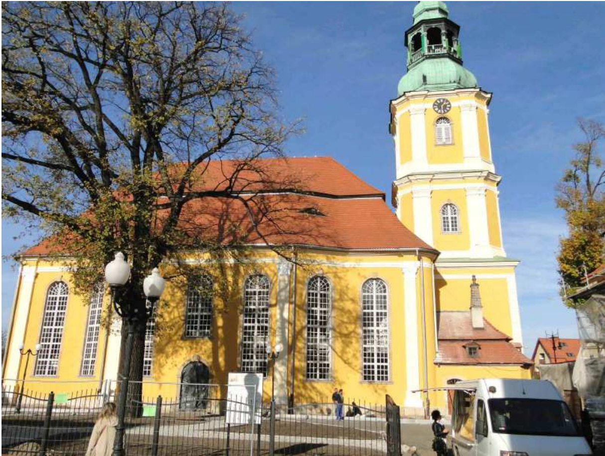
Südansicht nach der Fassadeninstandsetzung, Dezember 2014