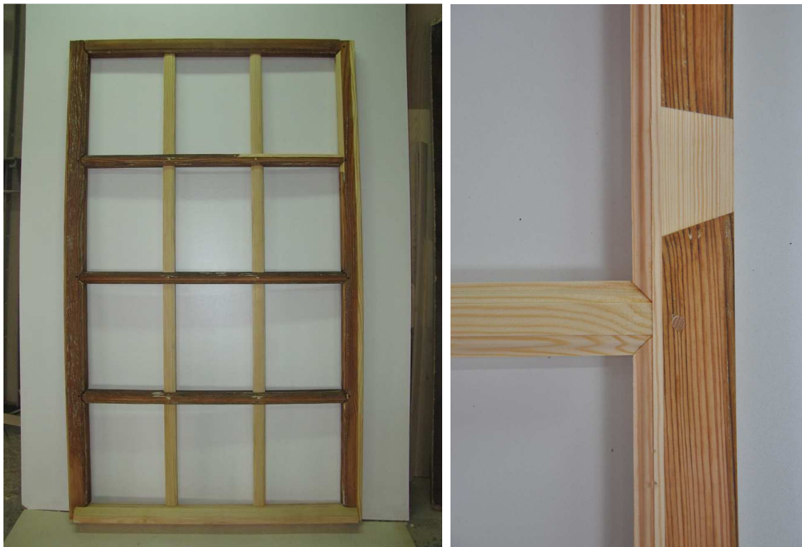
Reparierte Schiff-Fenster, 2013 (Etappe 3)